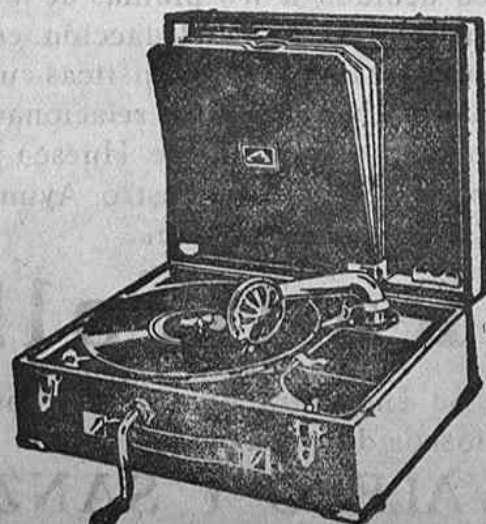
GRAMOLA, 210 ptas.

Relojes pared y bolsillo a precios muy baratos