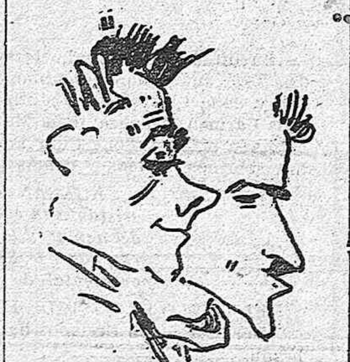
CICLISMO.—LOS HERMANOS NARCY