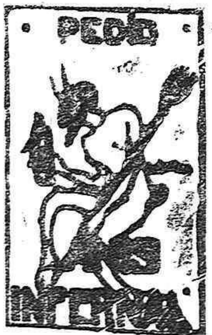
De venta en Caja y principalis Compañía de Ultramarinos.

Las mejores plumas estilográficas, las que se venden a 25 y 30 pesetas, nosotros a 10. También tenemos pluma de fiera automática a 1,50.