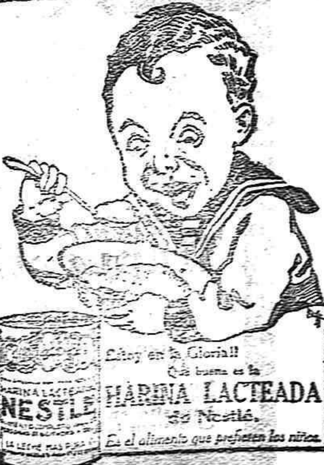
NESTLÉ LACTEADA Es el alimento que prepara las niñas.