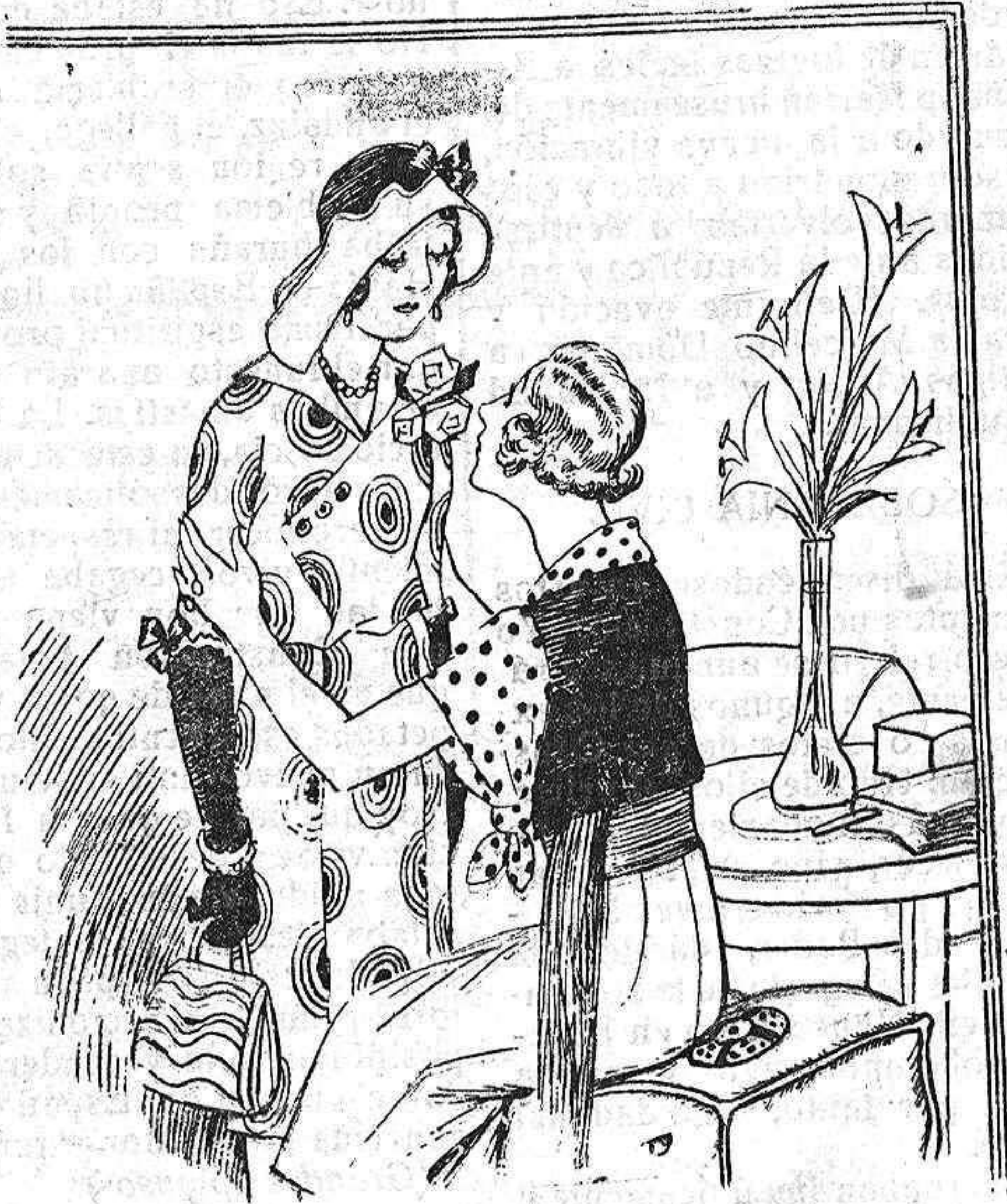
— Como quedarme a almorzar, me quedaria con mucho gusto, ¿sabes? Pero como estás sola... Tendrás que prestarme un vestido. Comprende que no voy a sentarme a la mesa así...

LA VOZ DE SORIA tiene a gran honor hacerse intérprete del cariñoso y entusiasta saludo de correligionarios y amigos, al que añade gustosísima el de los elementos que la integran.