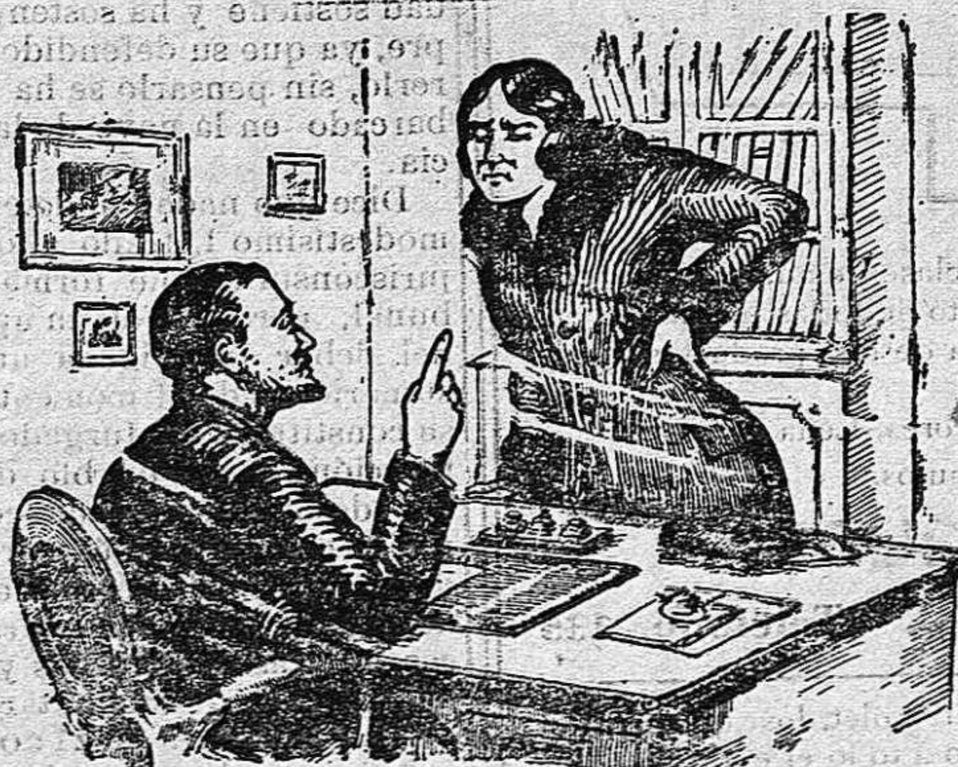
La Señora. — ¿... un emplasto? No me alivian nada. El Doctor. — ¡Fíjese bien! Le digo un EMPLASTO BERTELLI. Aplíquesele donde sienta el dolor y logrará rápido y seguro efecto. Pero exija el verdadero EMPLASTO BERTELLI, que produce calor, y obtendrá pronto remedio contra sus dolores. Sólo cuesta 1'65 pts.

A preguntas del señor Presidente del Tribunal, los procesados manifiestan que no tienen nada que exponer después de lo dicho por