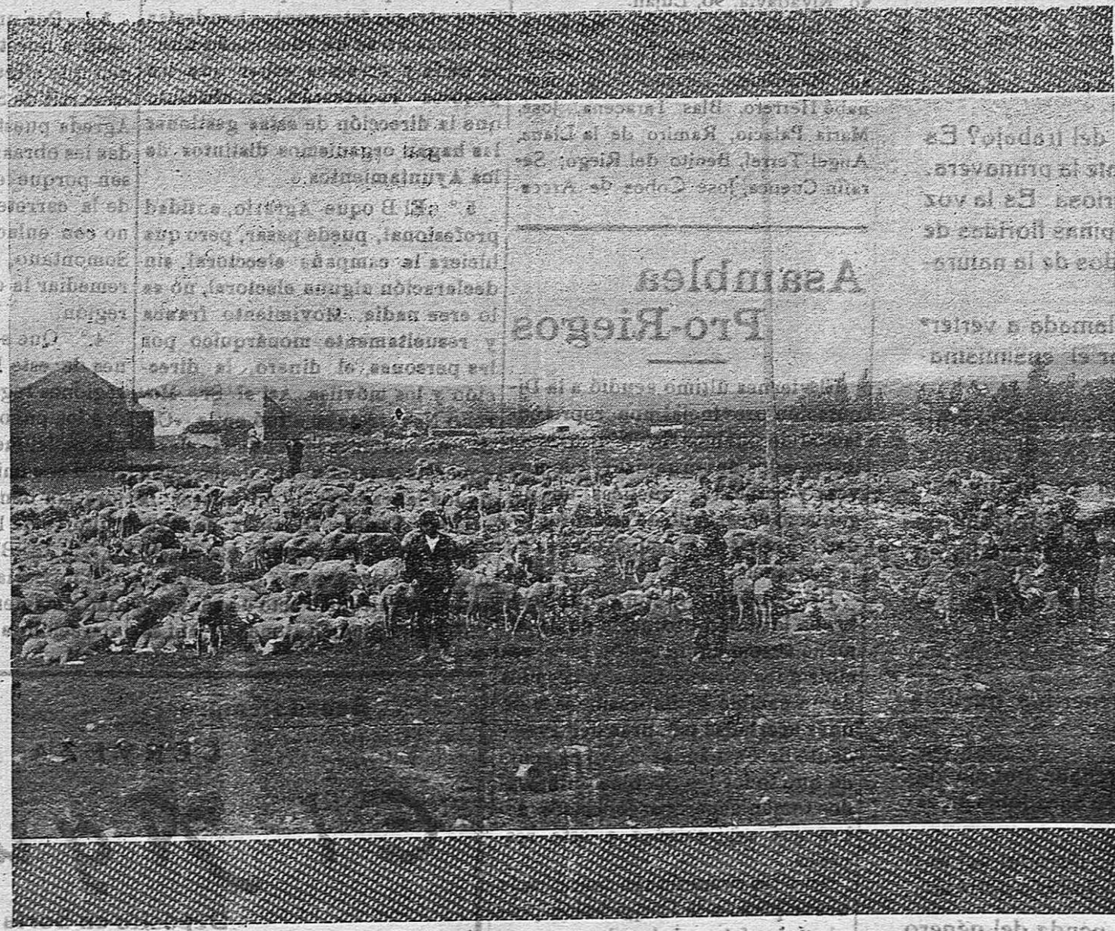
Antes de marchar para tierras de Extremadura, adonde estos rebaños hallarán abundantes pastos y clima grato, ha sido obtenida la presente foto, en un campo de la tierra de Soria.

A pesar de todo, los rostros de las gentes, son en los mo-