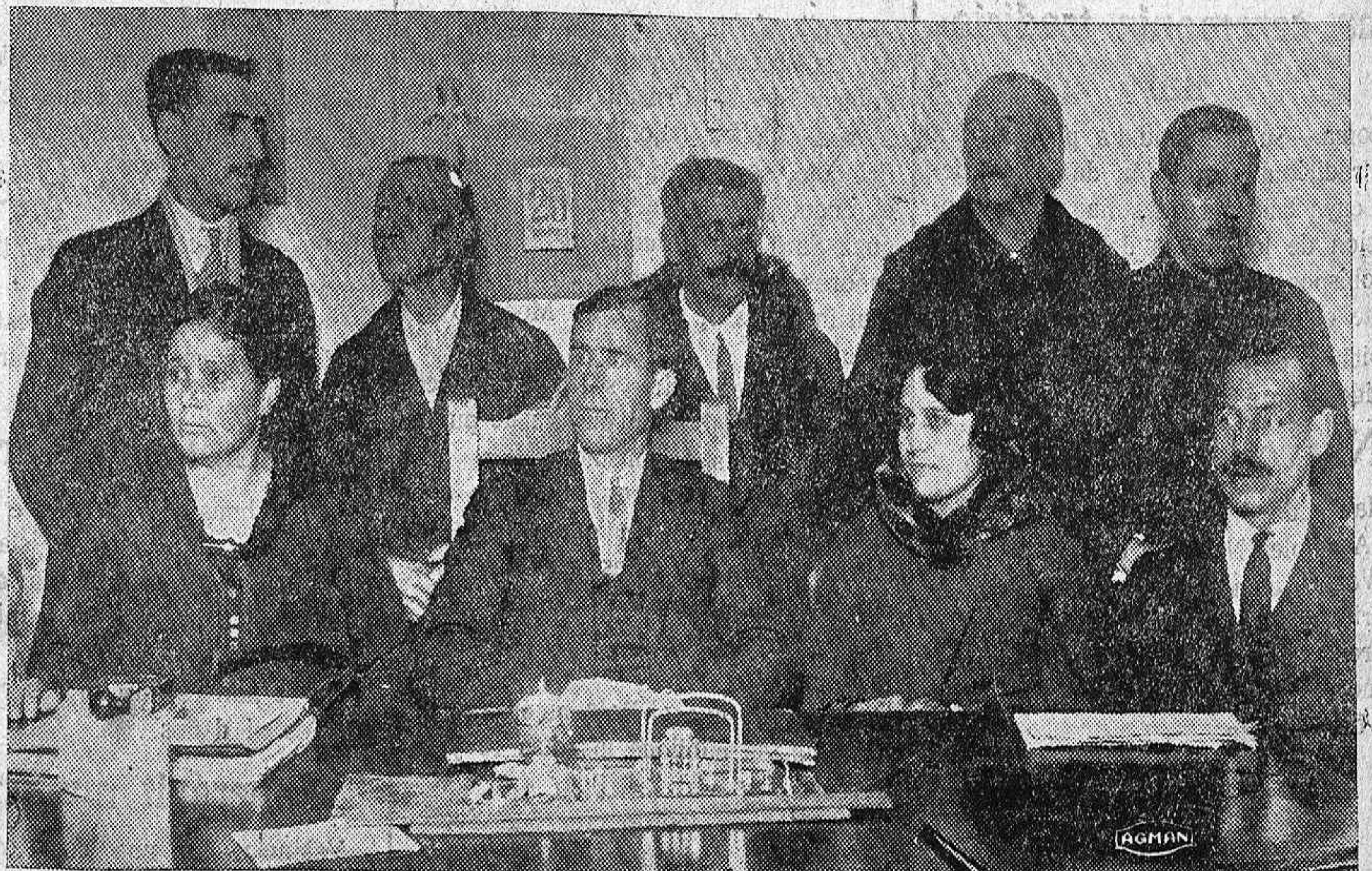
Señores que integran el Comité del Paro Forzoso, del Sindicato Católico.