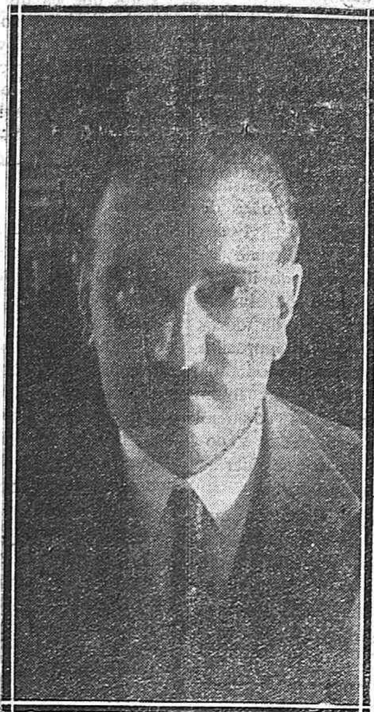
EL CONDE DE VALLELLANO Alcalde de Madrid, que ha hecho interesantes declaraciones para nuestro periódico