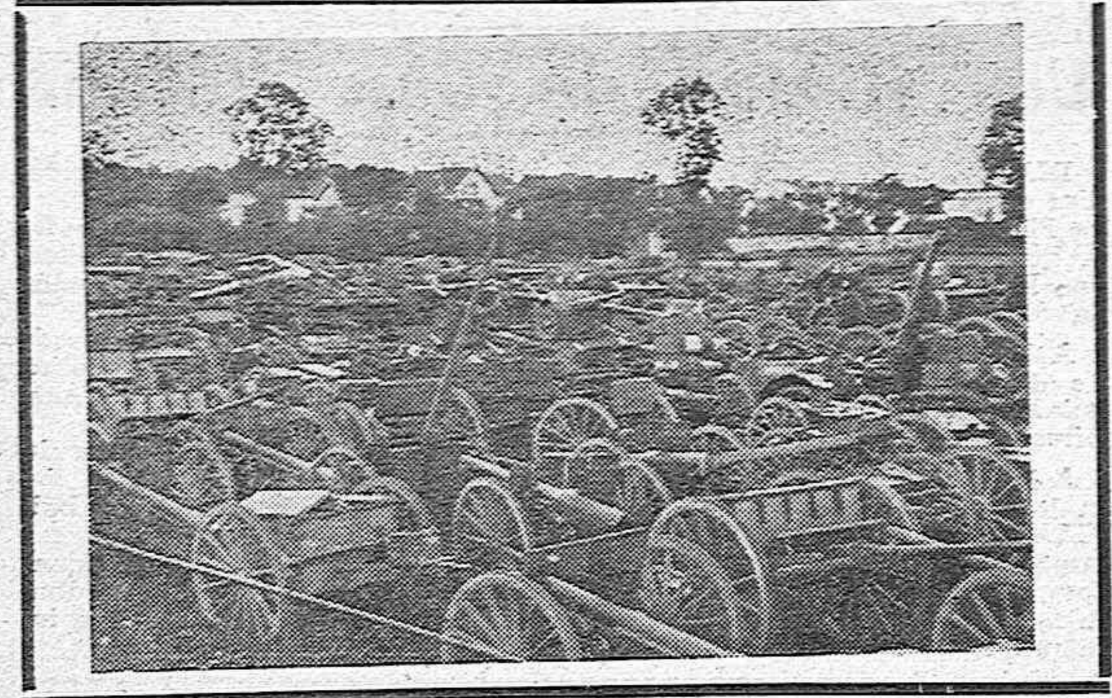
Es inmenso el botín que los alemanes vienen recogiendo en Francia. En este depósito se ven todos los tipos de cañones.