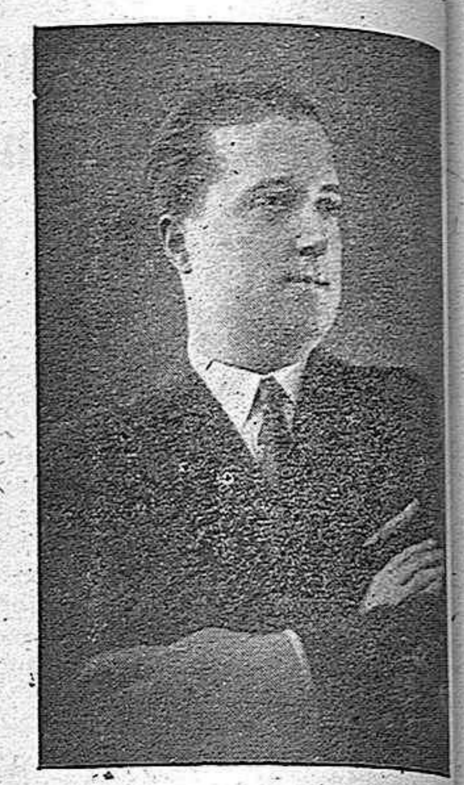
BALTASAR LARA Eminent tenor de la Compañía Angeles Ottein