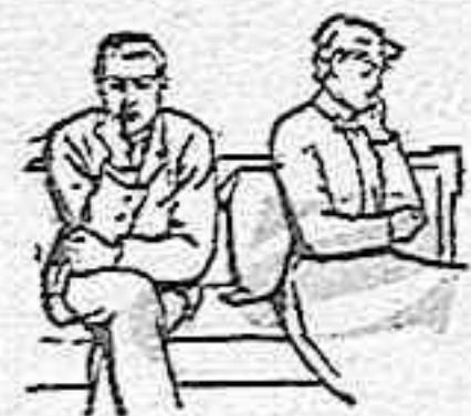
En la Neurastenia

Produce este ELIXIR efectos admirables. Los dolores profundos de cabeza, fatiga, insomnio, dolores medulares, desarreglos gástricos y demás padecimientos que consumen poco a poco al enfermo y terminan en el abatimiento, impotencia y postración general, desaparecen al poco tiempo con el uso de este específico, notándose ya desde las primeras tomas un aumento de fuerza y de agilidad que ponen rápidamente al enfermo en estado de completa curación.