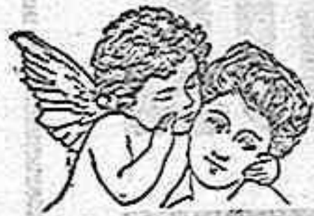
En la Anemia y Clorosis

DOSIS: (Una cucharadita de café al principio de cada comida). Su sabor agradable le hace preferible al aceite de hígado de bacalao al que substituye con ventaja.