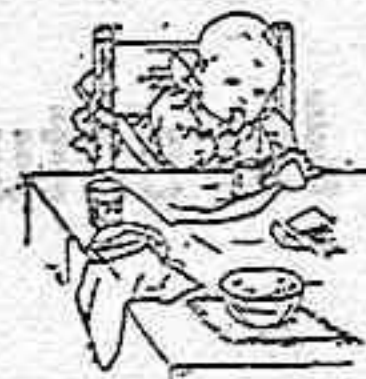
En el Raquitismo

Produce este ELIXIR efectos admirables. Los dolores profundos de cabeza, fatiga, insomnio, dolores medulares, desarreglos gástricos y demás padecimientos que consumen poco a poco al enfermo y terminan en el abatimiento, impotencia y postración general, desaparecen al poco tiempo con el uso de este específico, notándose ya desde las primeras tomas un aumento de fuerza y de agilidad que ponen rápidamente al enfermo en estado de completa curación.