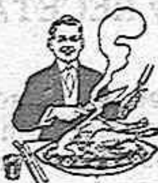
En la Dispepsia

Recobra poco a poco el rostro su color natural, desaparece la melancolía tan propia de esta enfermedad, cálmense los dolores, de las menstruaciones, regularizándose éstas periódicamente y se modifica de tal modo el estado general de la enferma, que de taciturna y triste tórnase alegre y lozana.