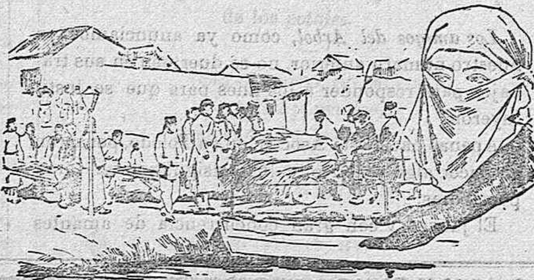
Máscara y guante protectores que usan los médicos y enfermeros que asisten á los atacados por la peste.

Habitantes de las cercanías de Kharbin conduciendo leña para quemar los cadáveres producidos por la peste.