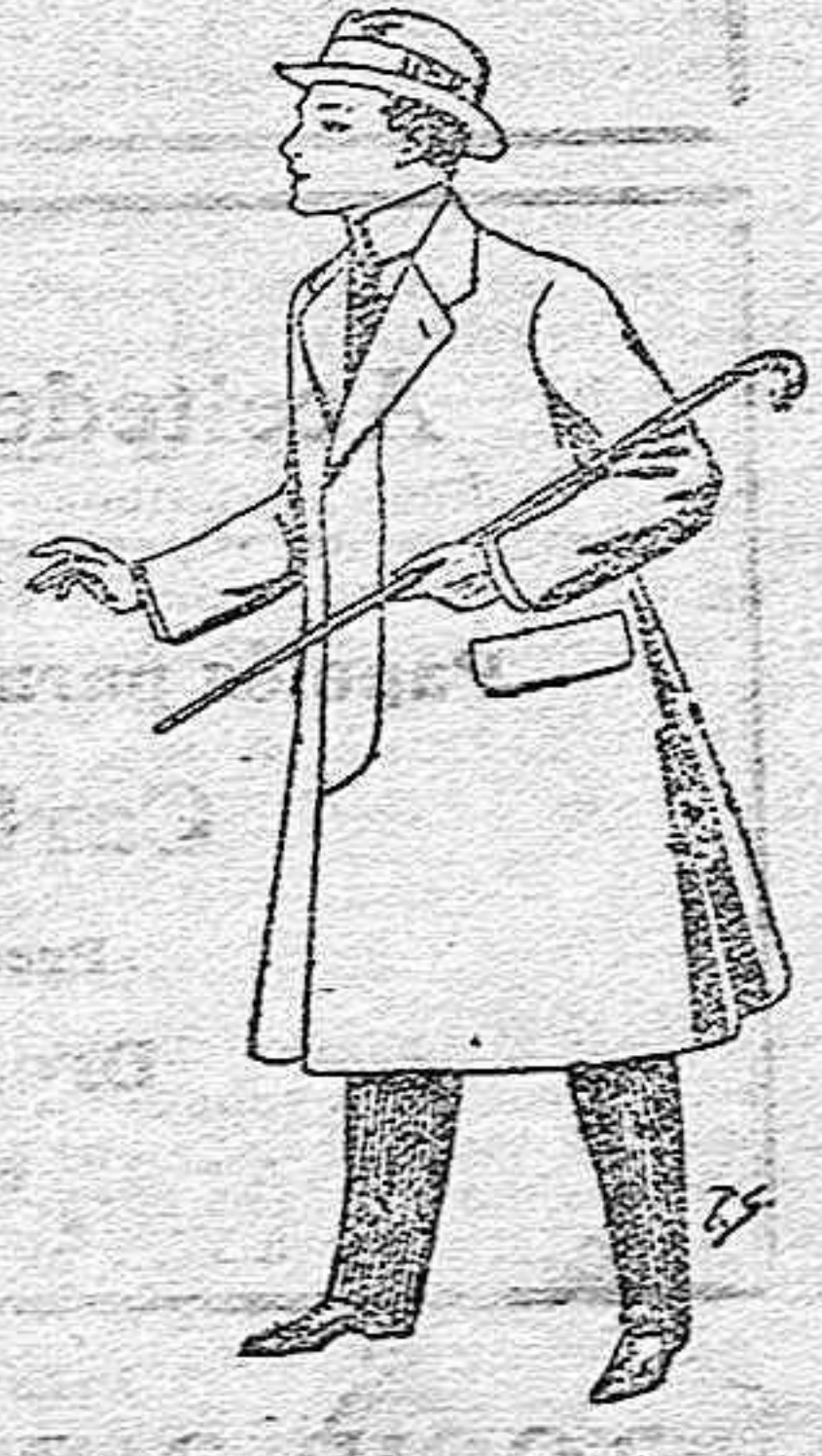
Gabanes de paten, melton y cheviot, con forros seda, saten o escocés, de pesetas 33 a 100.