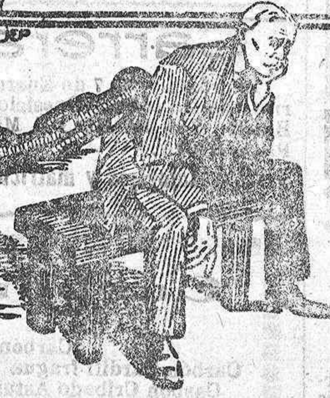
Depositarlo General de DALMAU OLIVERES 14. Paseo de la Industria BARCELONA