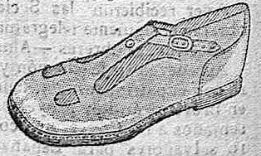
Bandallas becerro color, tallas del 21 a 37 de ptas. 7 a 16, según tallas.

Ropas confeccionadas para Caballero, Señora, Niño y Niña.