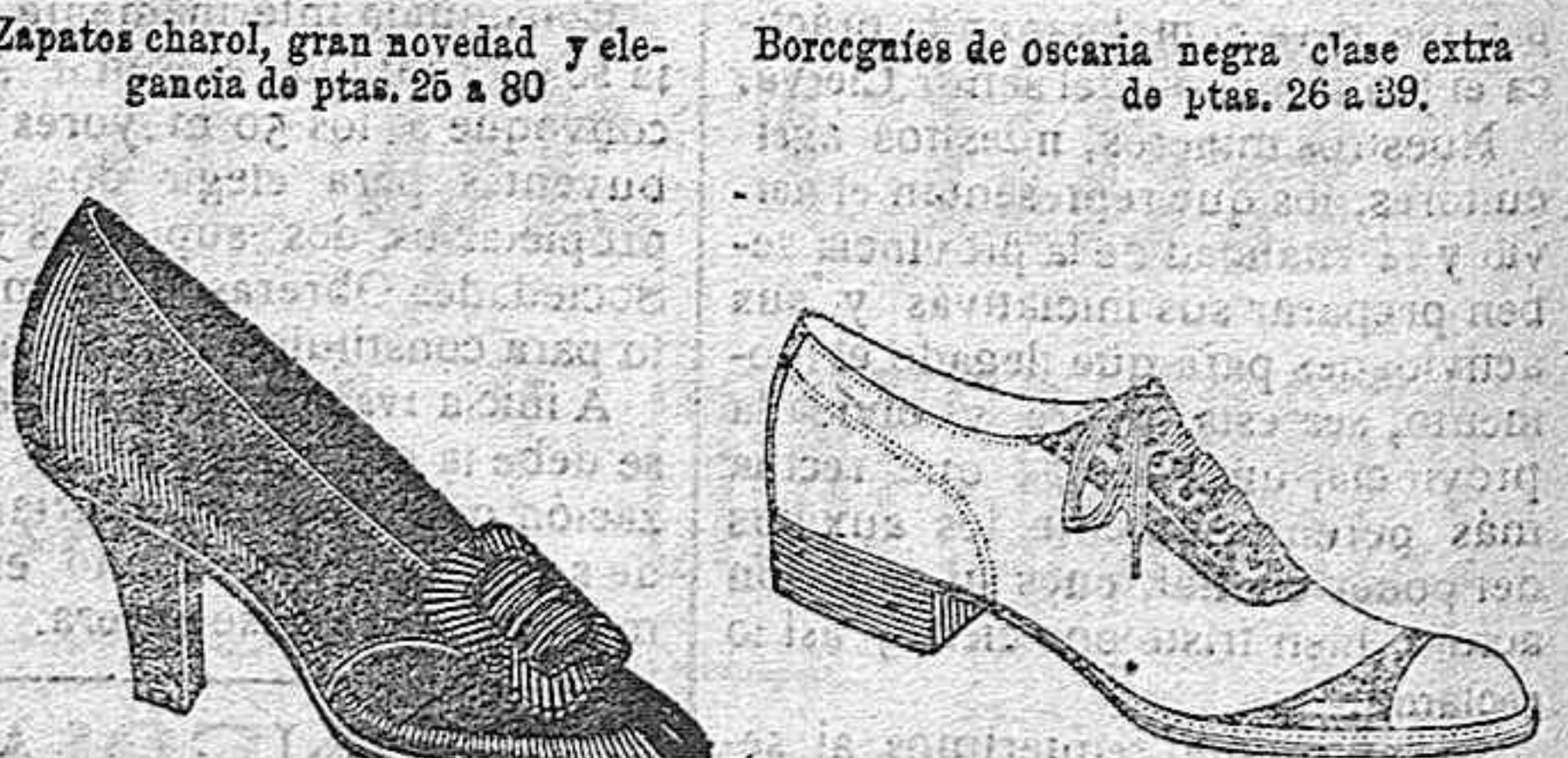
Zapatos charol, gran novedad y elegancia de ptas. 25 a 30