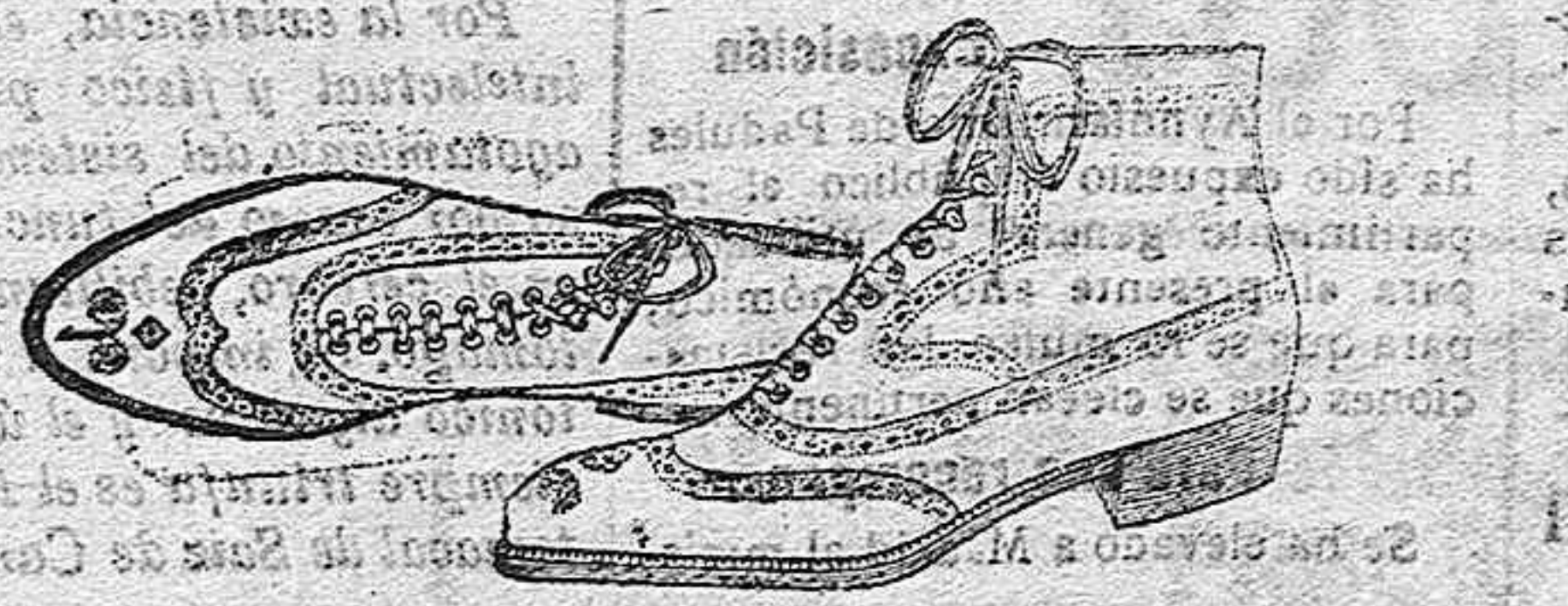
Boregues becerro, en negro y color de ptas. 26 a 50

Sucursales: Madrid, Barcelona, Alicante, Bilbao, Cádiz, Cartagena, Gijón, Granada, Málaga, Palma de Mallorca, Santander, Sevilla, Valencia, Valladolid, Zaragoza.