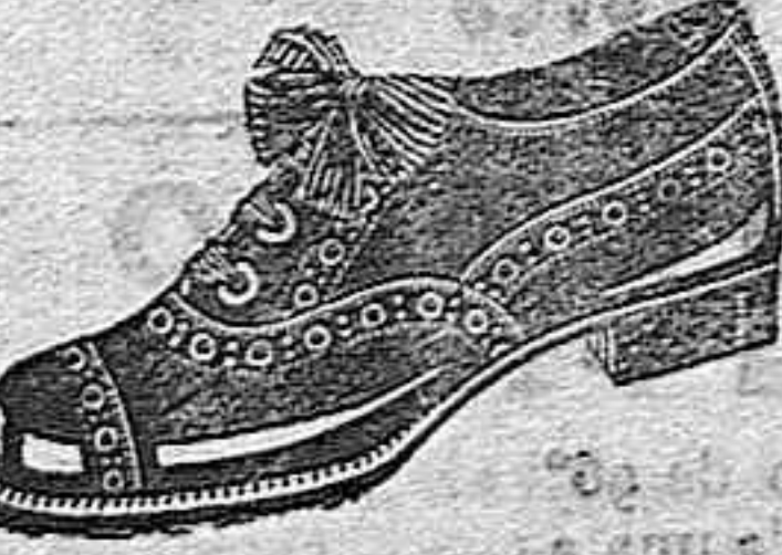
Zapatos oscaria negra tallas del 24 al 35 de ptas. 15 a 16, según tallas. Los mismos, en charol, de ptas. 17 a 19-50