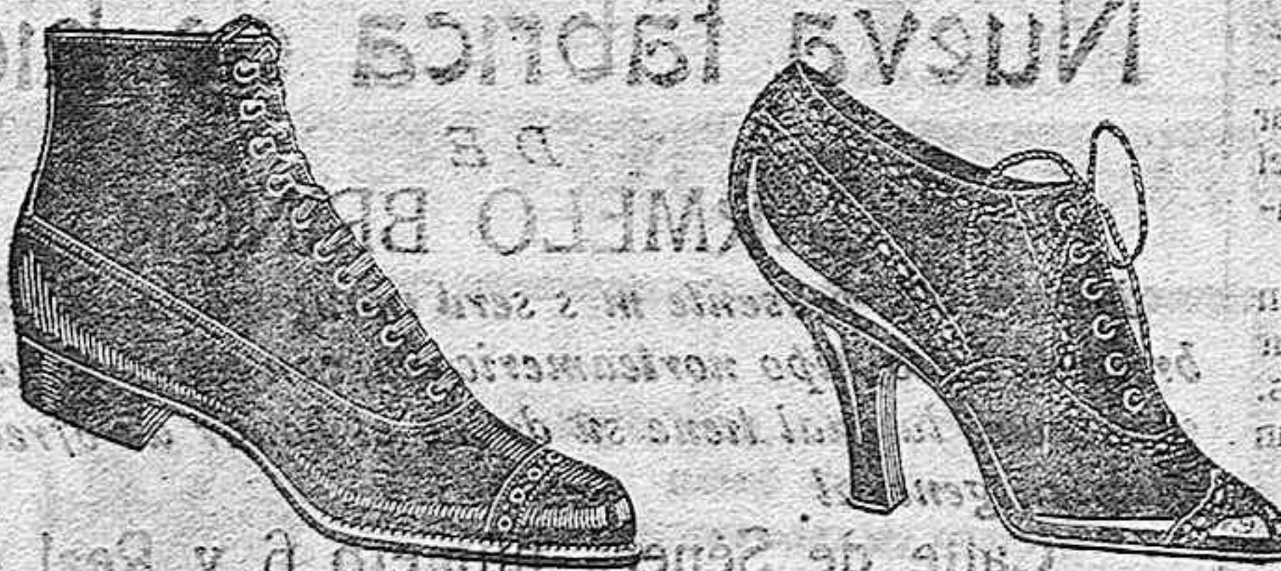
Boregues de oscaria pais, negra, de ptas. 10 a 25