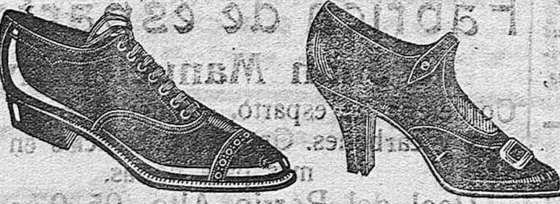
Zapatos oscaria negra, de ptas. 18 a 30