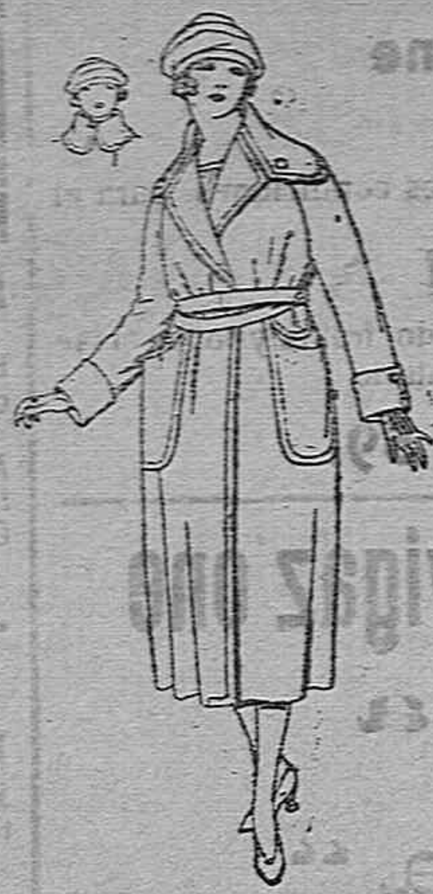
Guardapolvos de dril, gabardina, alpaca, etc., diferentes colores, de ptas. 30 a 65