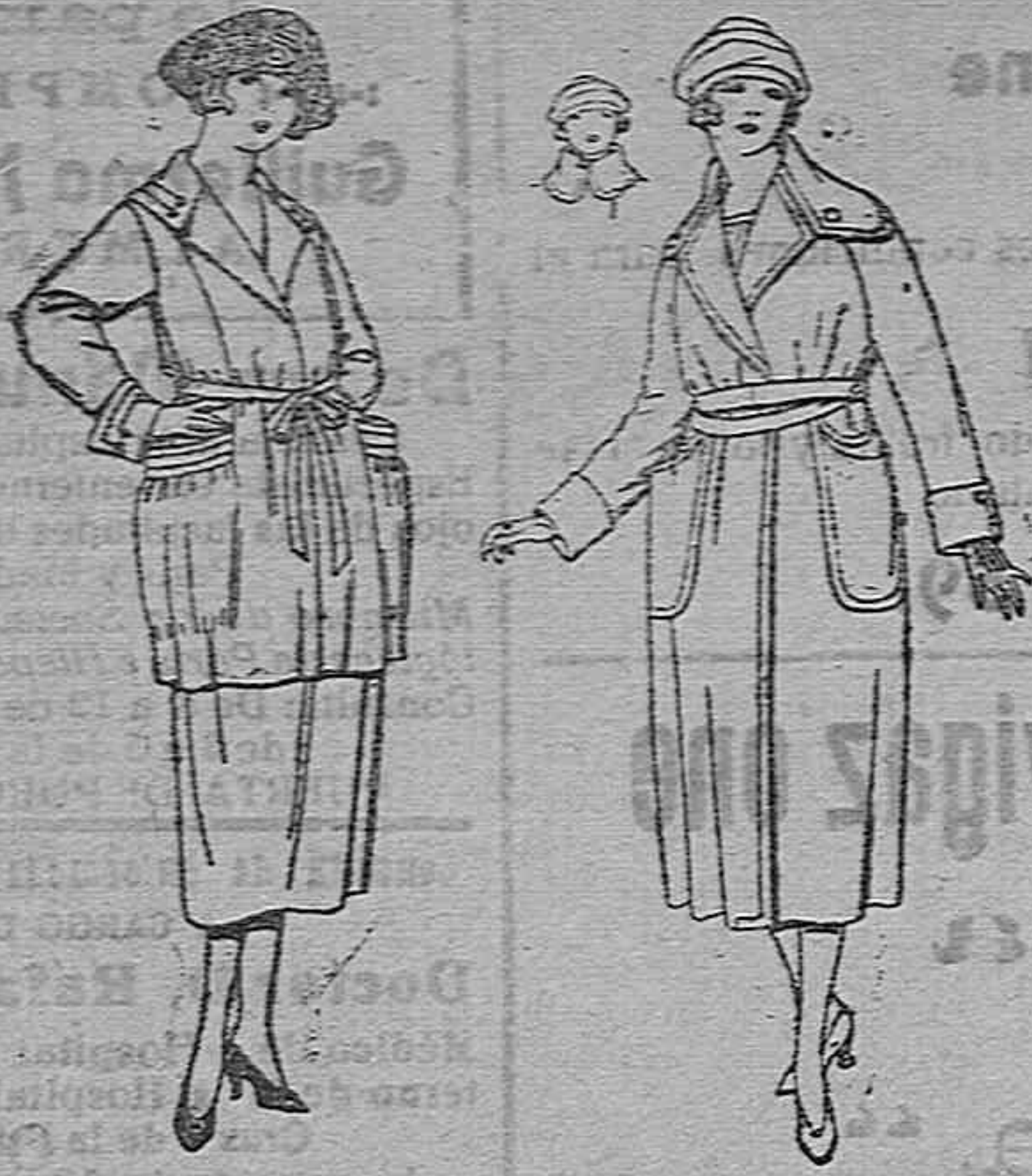
Trajes de gabardina, lanilla, estambre, etc., en negro, azul, y color, pespunte de adorno, de ptas. 135 a 150

SUCURSALES: Madrid, Barcelona, Alicante, Bilbao, Cádiz, Cartagena, Gijón, Granada, Málaga, Palma de Mallorca, Santander, Sevilla, Valencia, Valladolid y Zaragoza.