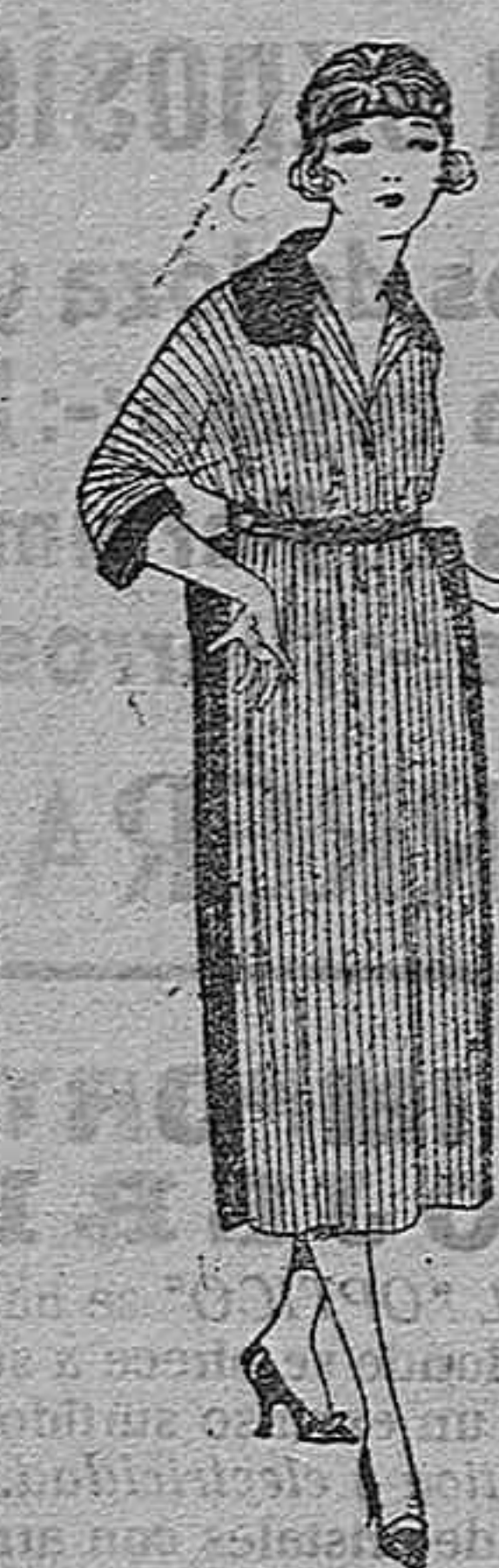
Batas de crespón percal, etc., de ptas. 18 a 29