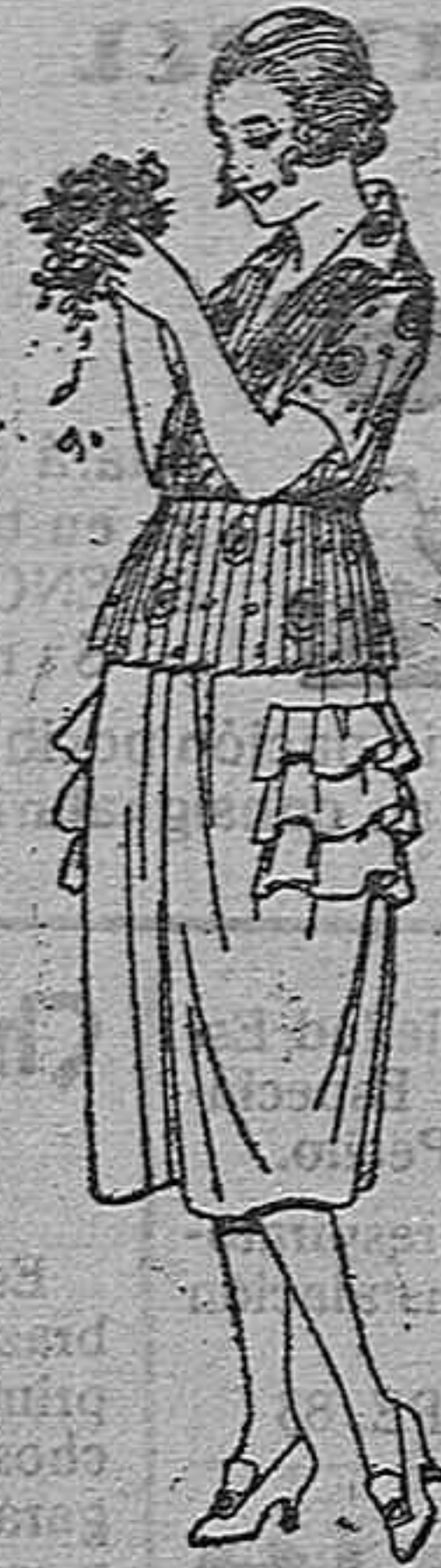
Blusas de voile estampado, diferentes dibujos, de ptas. 18 a 25