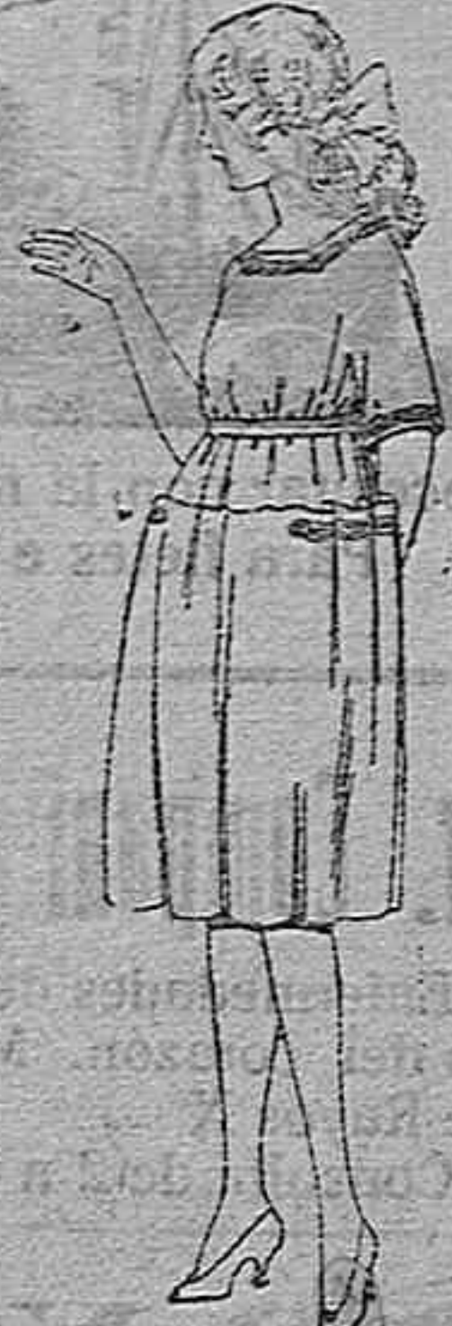
Vestidos de lanilla, gabardina, sarga, etc., en azul y colores, para jovencitas de 12 a 15 años, de ptas. 55 a 65