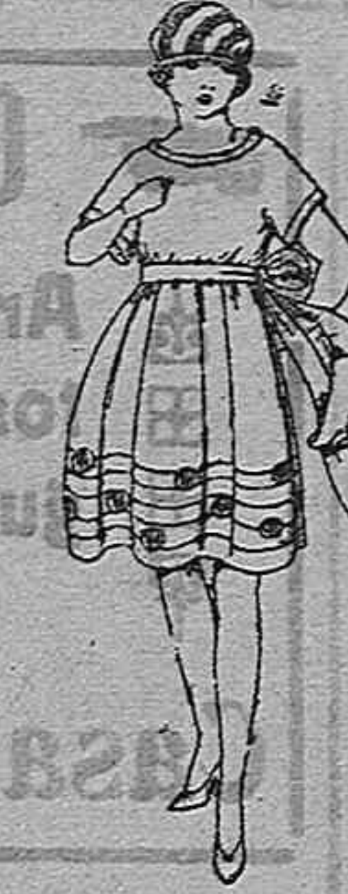
Vestidos de voile blanco y colores, adornos bordados, para jovencitas de 12 a 15 años, de ptas. 45 a 58

Ropas confeccionadas para Caballero, Señora, Niño y Niña