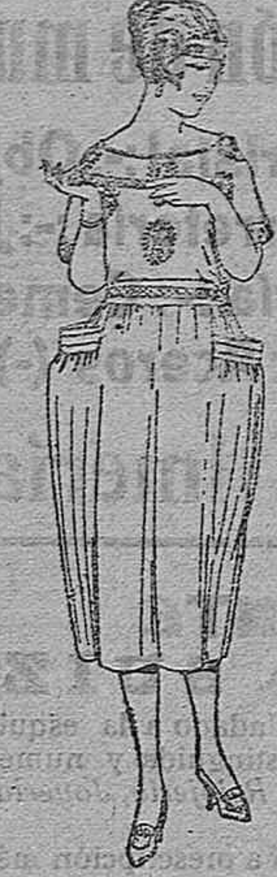
Blusas de crespón estampado, diferentes dibujos, de ptas. 38 a 60