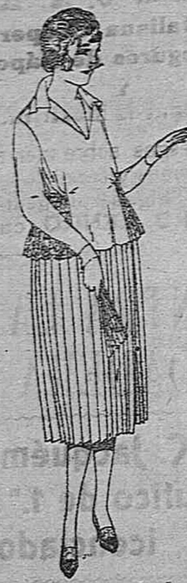
Blusas de velo de algodón, blanco y negro, adornos bordados, de ptas. 16 a 22