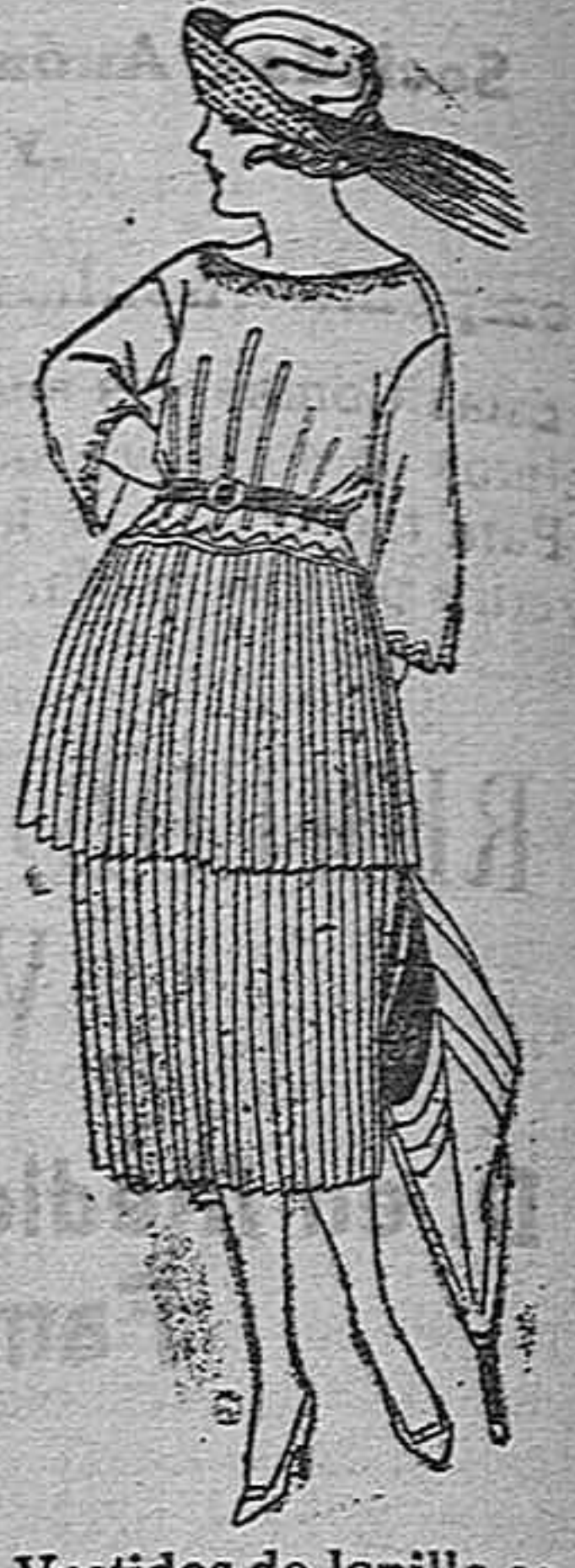
Vestidos de lanilla, estambre, etc., plisados y adornos bordados, de ptas. 120 a 140