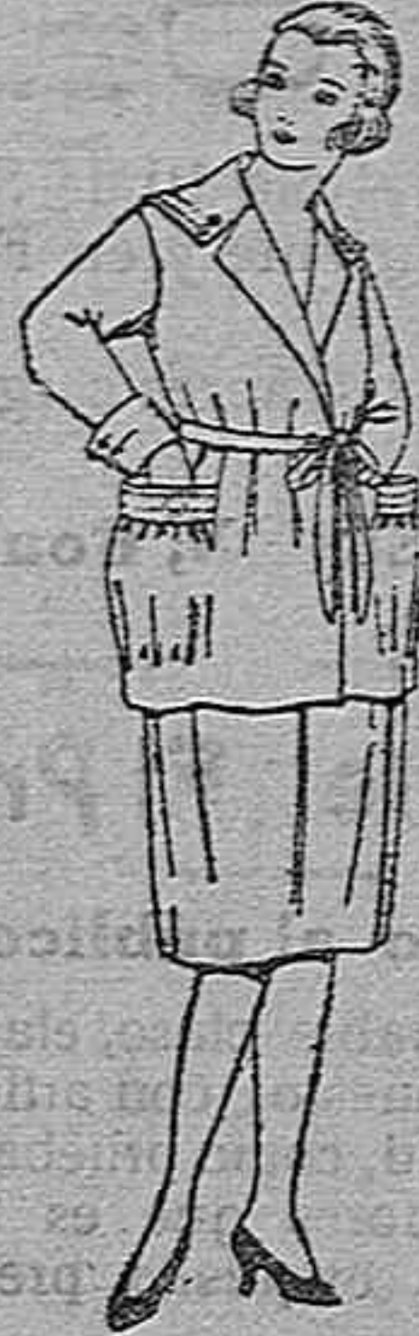
Trajes de sarga inglesa, gabardina, etc., en azul y colores, pespunte de adorno para jovencitas de 13 a 15 años, de ptas. 45 a 58