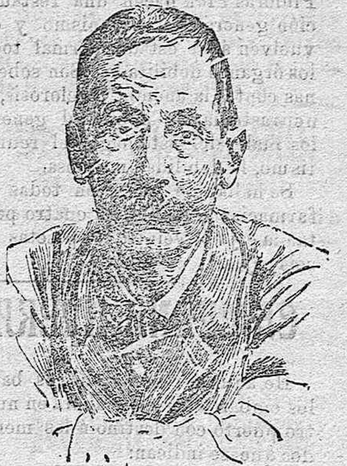
D. Benito Perez Galdós,

autor de la serie «Epi-odios Nacionales». El último tomo publicado se titula «Prim», y ha alcanzado, como los anteriores, un éxito extraordinario.