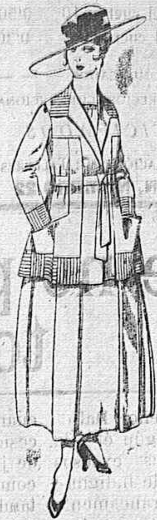
Trajes de lanilla negro, azul, y color, bordado, á pesetas 90.