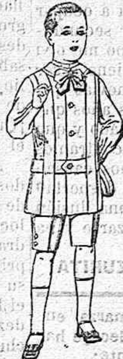
Trajes de lanilla, melton, etc. para niños de 4 á 7 años. De ptas. 16 á 33.