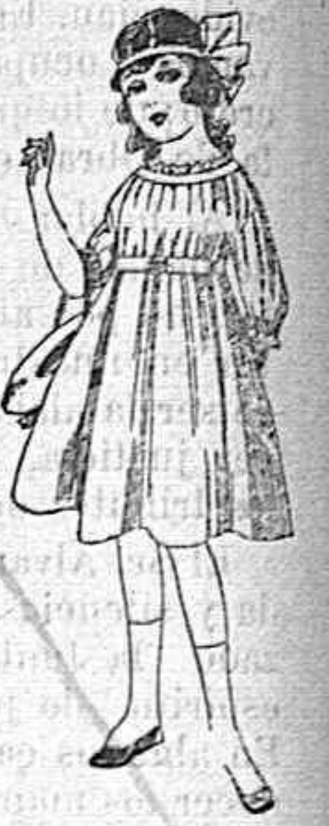
Vestidos de lana, azul, para niñas de 4 á 9 años. De pesetas 22 á 25 Los mismos en voile. De pesetas 10 á 17