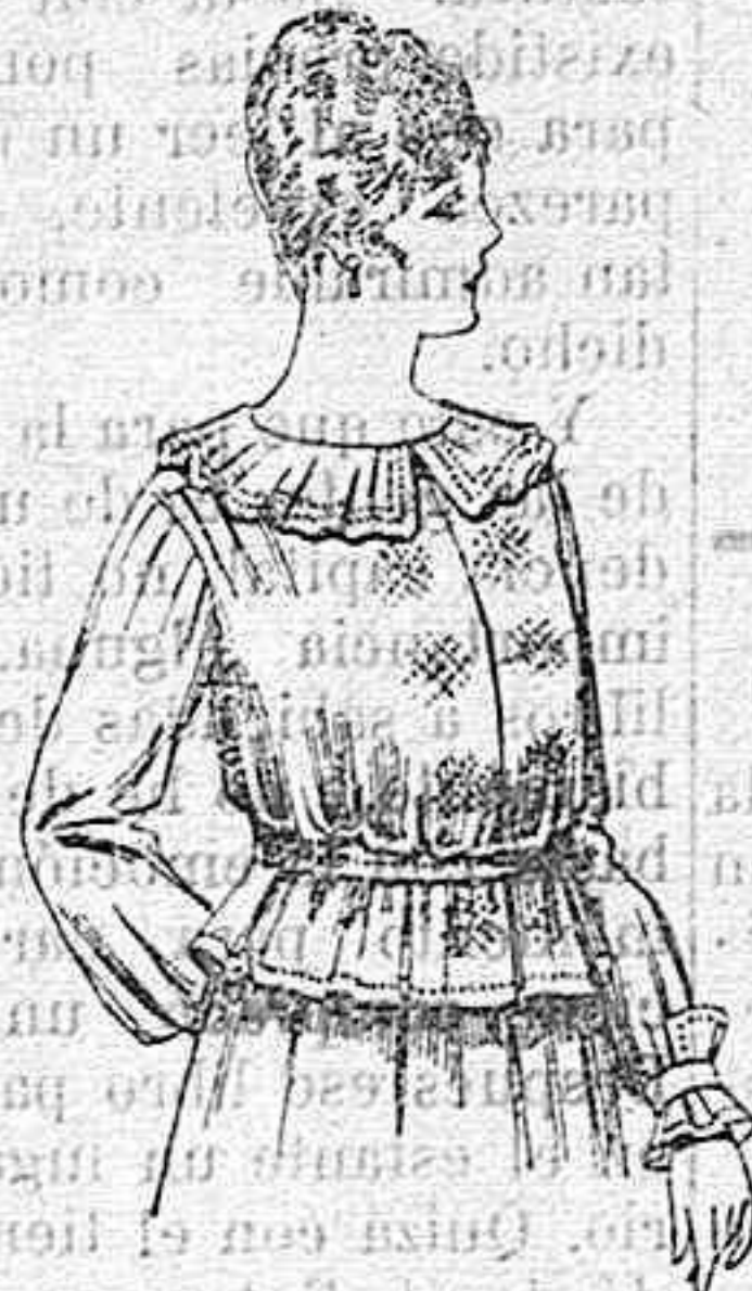
Blusa de crespón ó seda, en negro, azul y color. A ptas. 33.