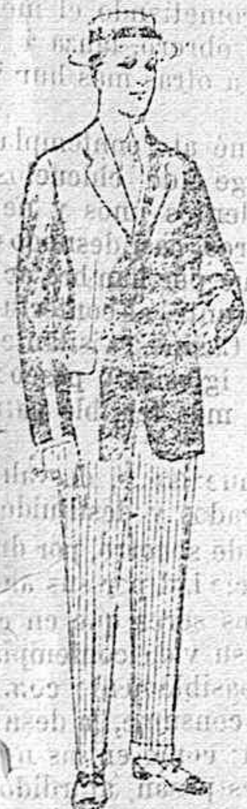
Trajes de lanilla, vicuña, etc., para jovencitos de 10 á 16 años. De pesetas 10 á 56