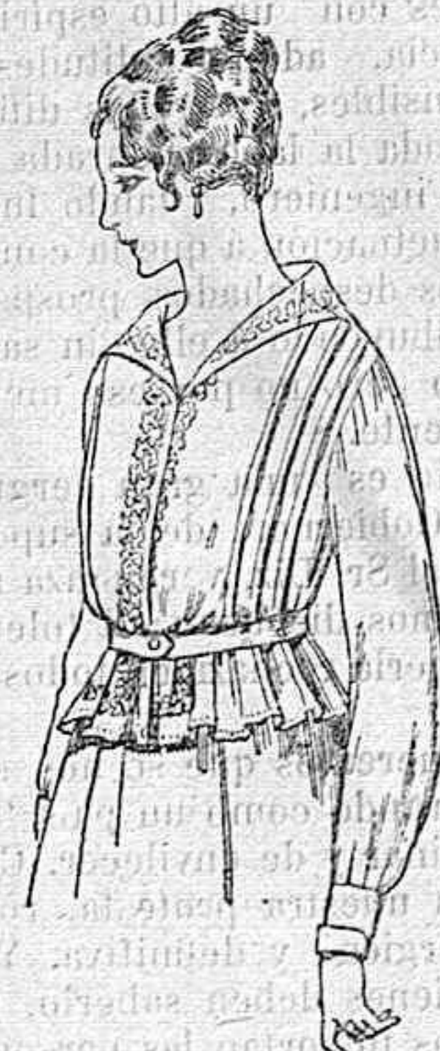
Blusa de voile blanco, bordados blancos, rosa ó azul A ptas. 9