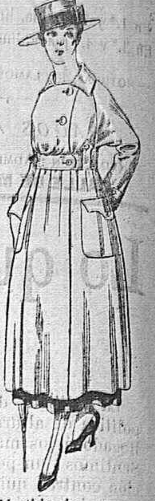
Vestido de estambre negro, azul y colores bordado De peseta 64 á 75