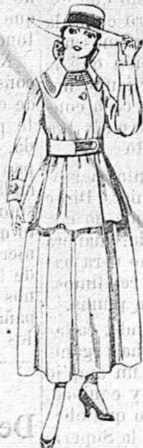
Trajes de lanilla negra, azul y color, para jovencitas de 13 á 16 años.