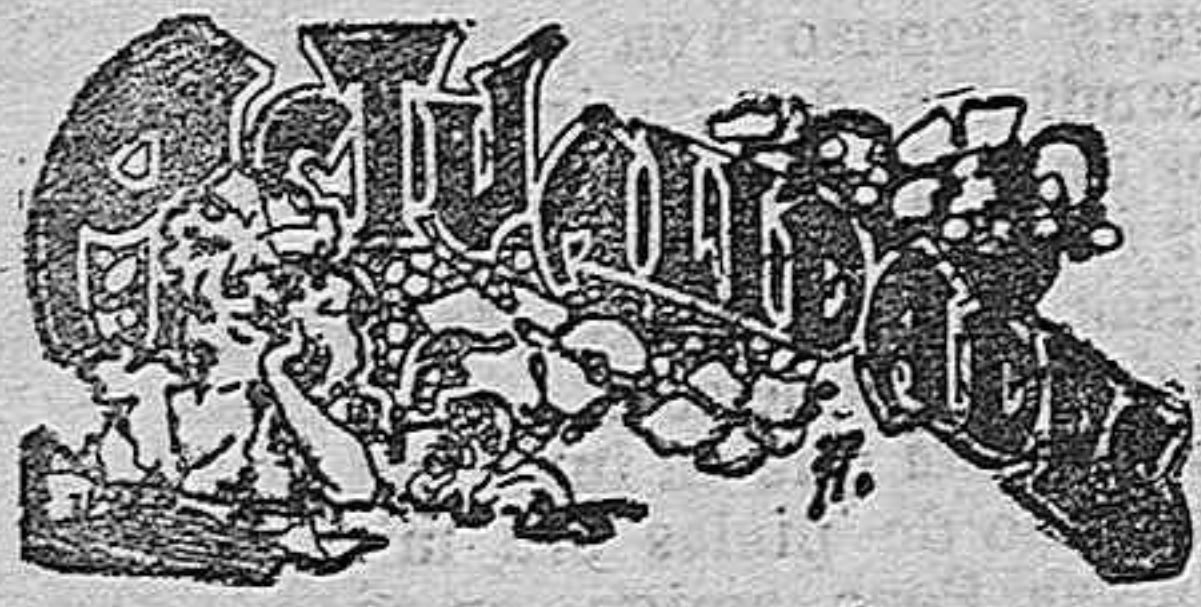
La Torre de San Marcos.

Del resultado obtenido para comunicarse entre sí los buques con los aparatos sistema Marconi, da fé el despacho de saludo transmitido desde el «Morisini», anclado en Palermo, al «Trinacria», alejado más de 150 kilómetros, en el cual se hallaba el rey, de camino para Palermo.