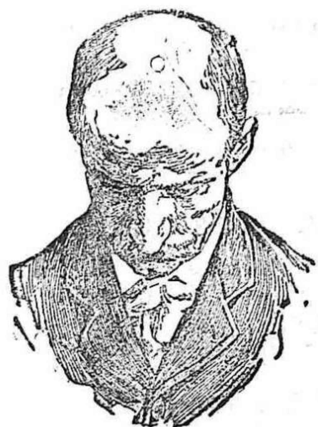
Antes de usar el Capilhol.