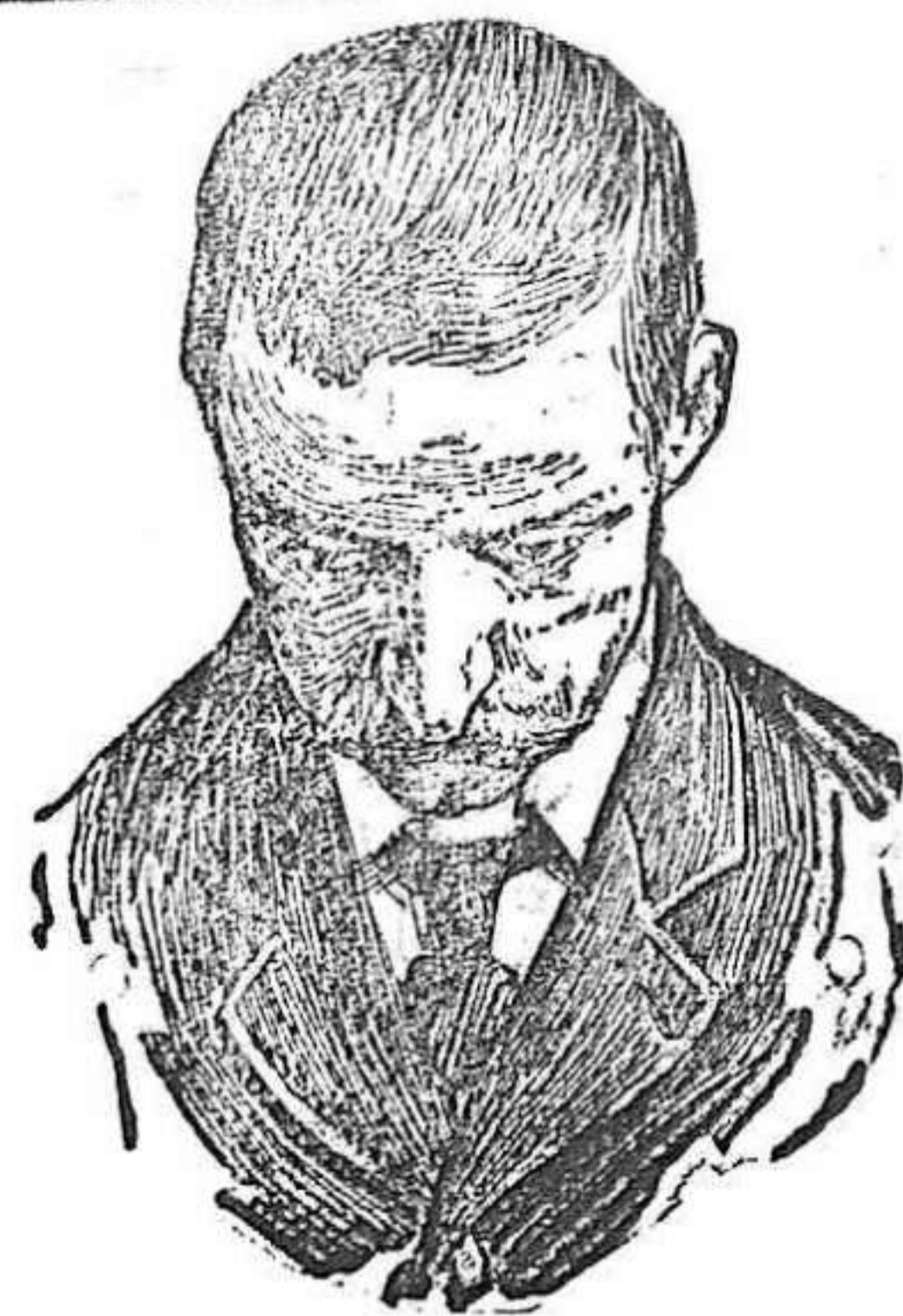
Después de usar el Capilho