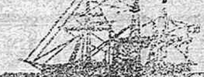
El magnífico vapor

Talleres Glorieta de San Pedro núm. 2. CLEMENTE LORENZO.