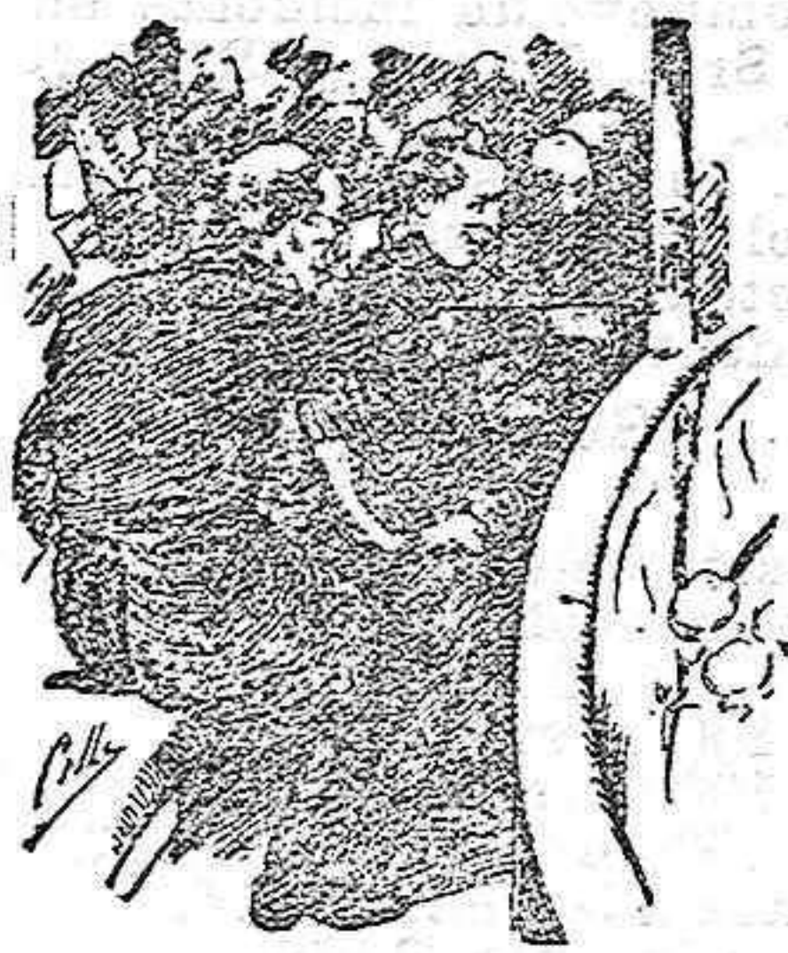
Desde la tribuna.

No es tan fiero el león, como... los periódicos lo pintan.