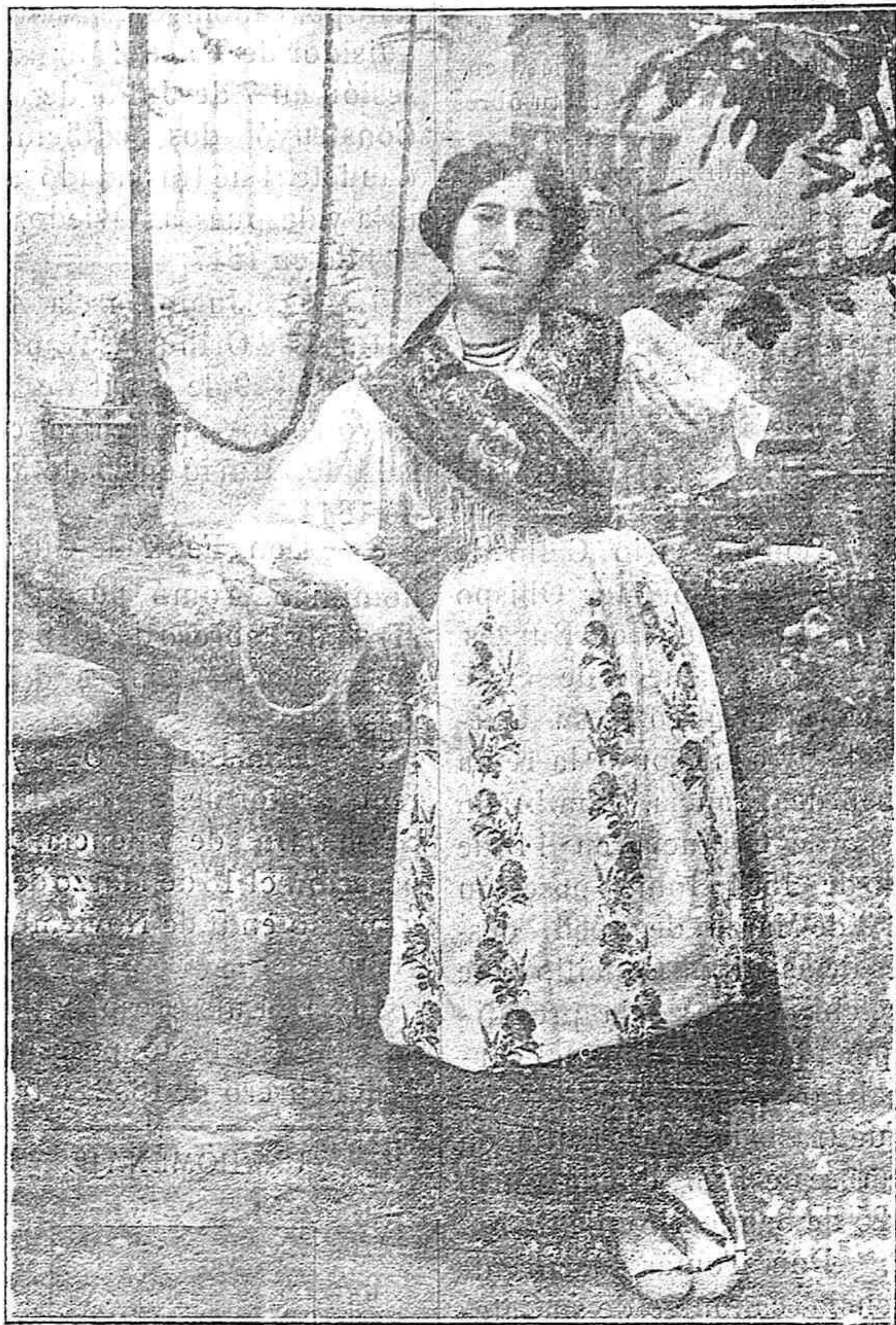
Joven de la vega vestida a la antigua usanza

el acueducto de Elche, la casa episcopal y la capilla de la comunión de Santa María; el palacio episcopal de Cox, amplió el Seminario, y falleció en 1790, sepultándosele en San Miguel.