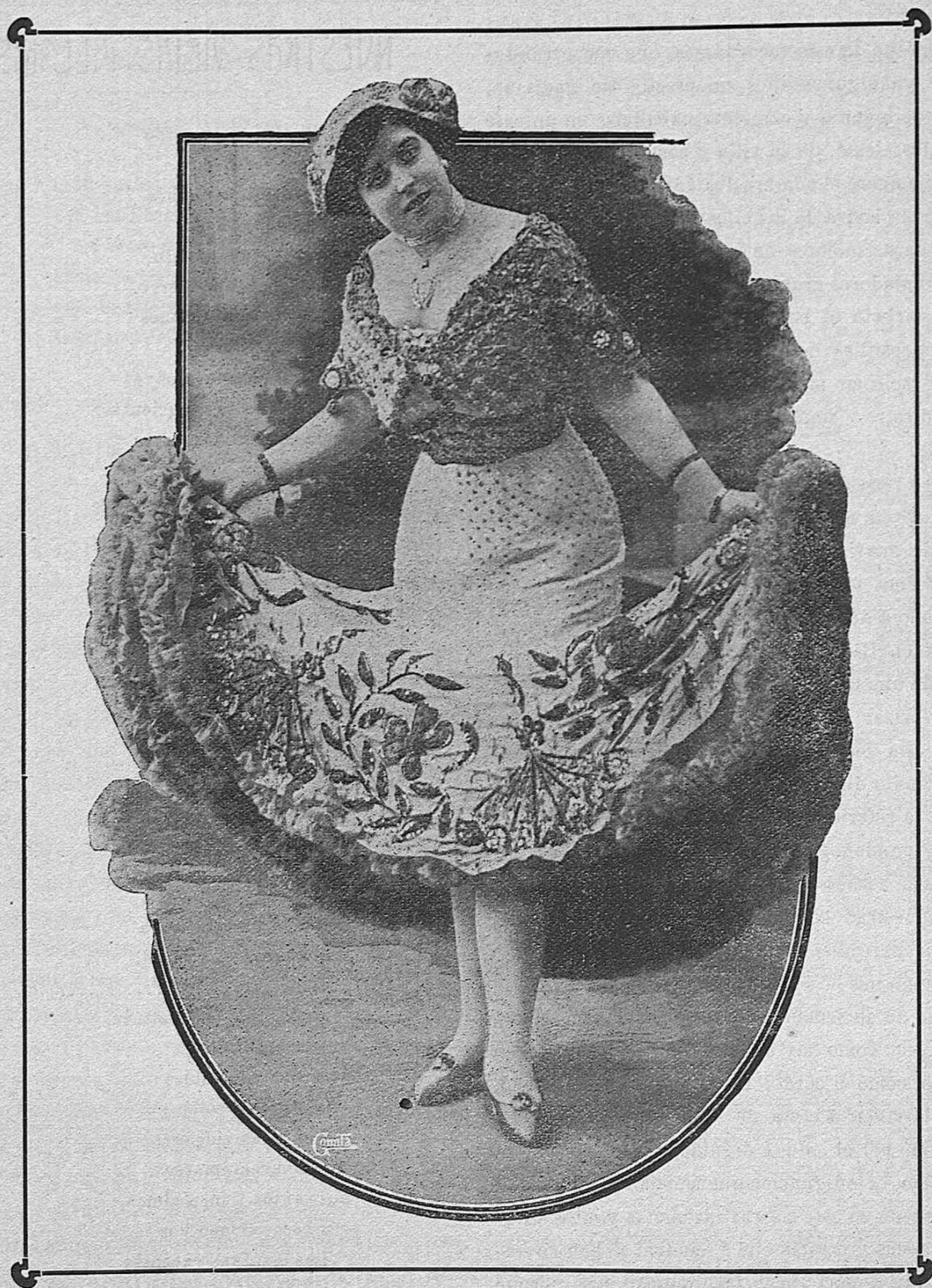
La popular canzonetista IDEAL NORMA