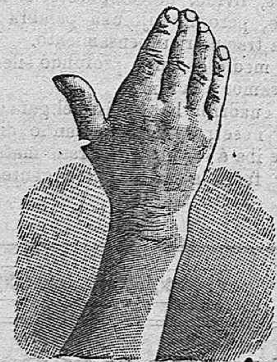
Después de 15 días de tratamiento