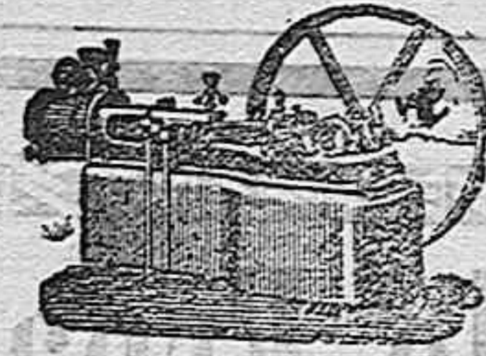
Máquina de vapor horizontal.