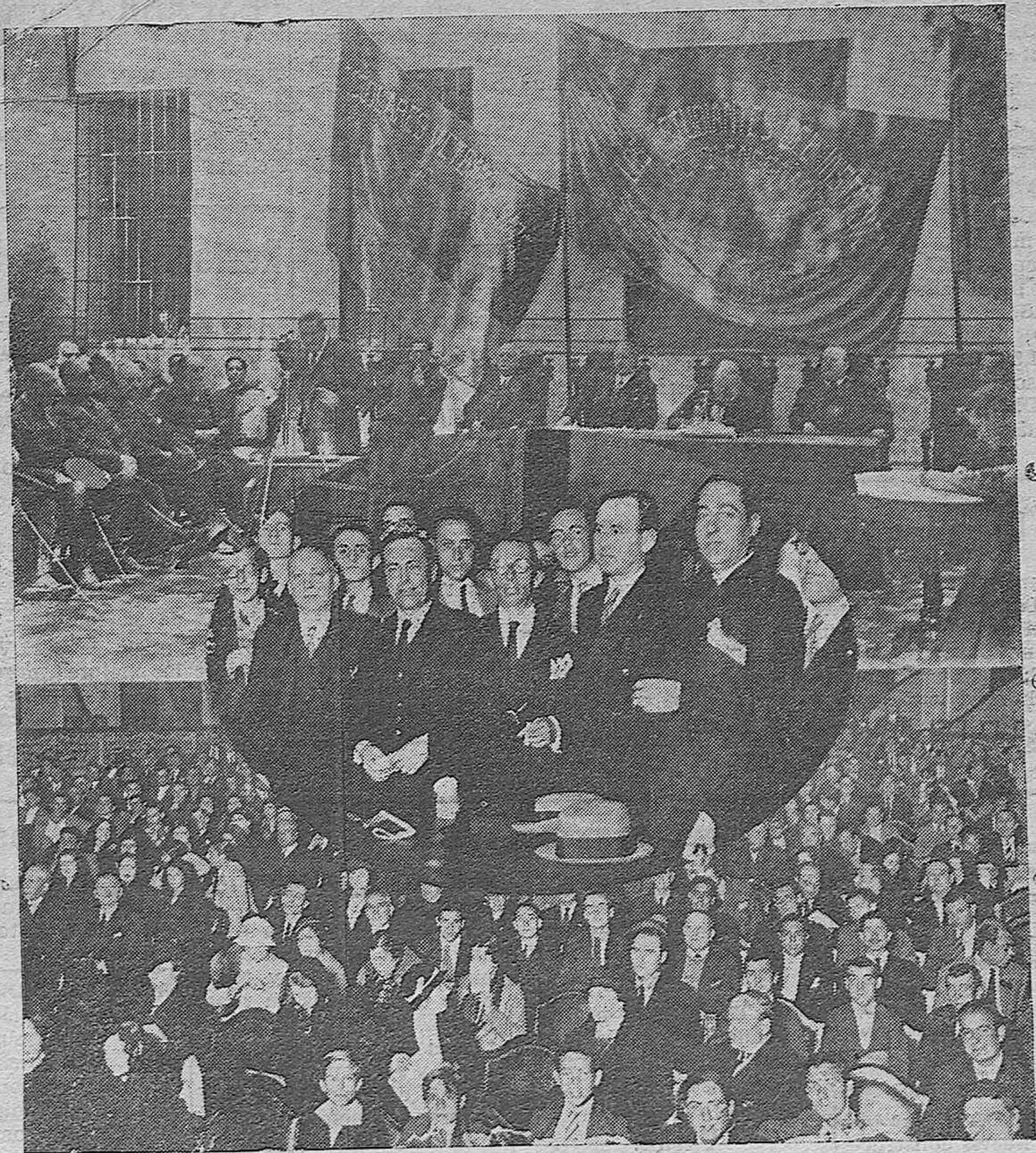
Arriba.-Presidencia del acto cultural celebrado en el Instituto, al que asistieron, y en el que tomaron parte, las autoridades y los directores de los centros docentes.-Abajo: Aspecto del Gran Teatro durante el acto celebrado por Acción Popular.-En óvalo: La presidencia del acto referido.