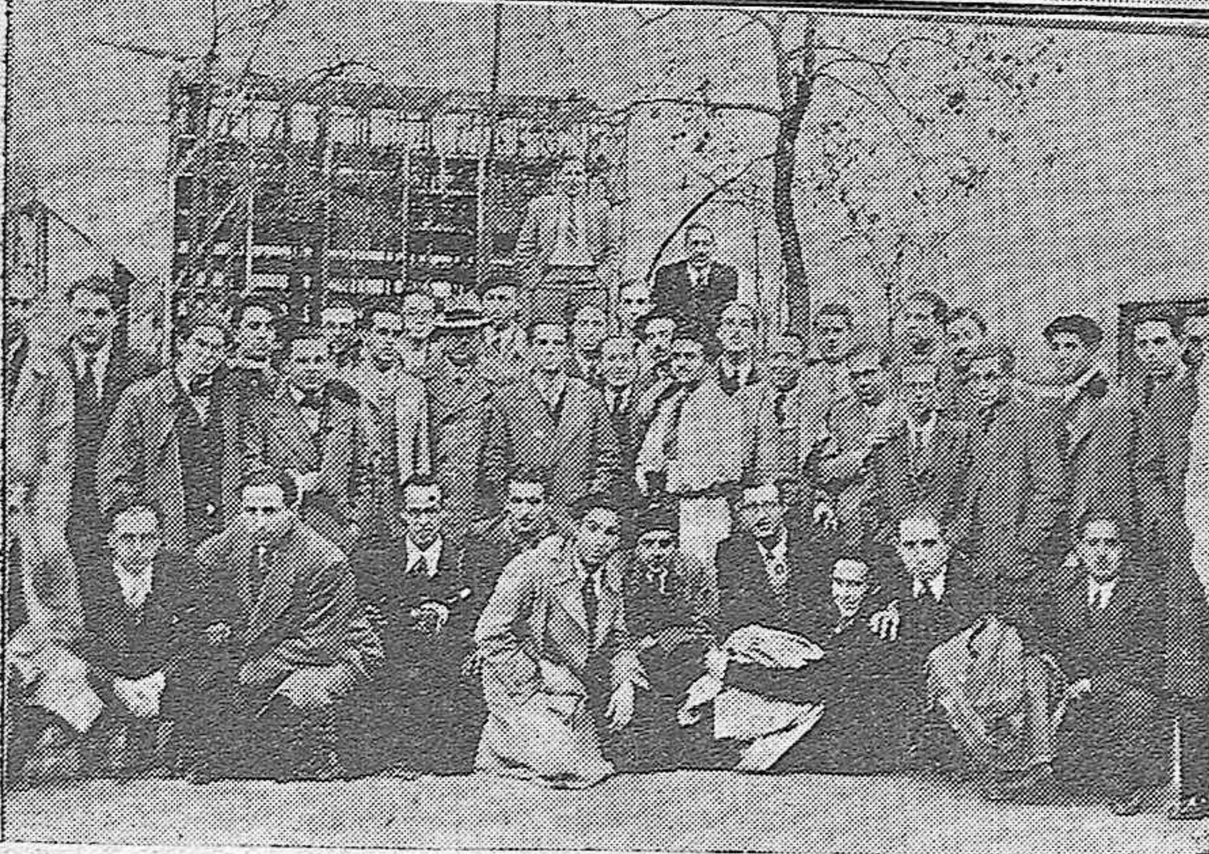
Arriba: Fiesta andaluza celebrada en la Huerta de la Reina como final de las verbenas con motivo de la Cruz levantada en el mencionado barrio.—Abajo: Estudiantes madrileños que han llegado a nuestra capital en viaje de estudios.