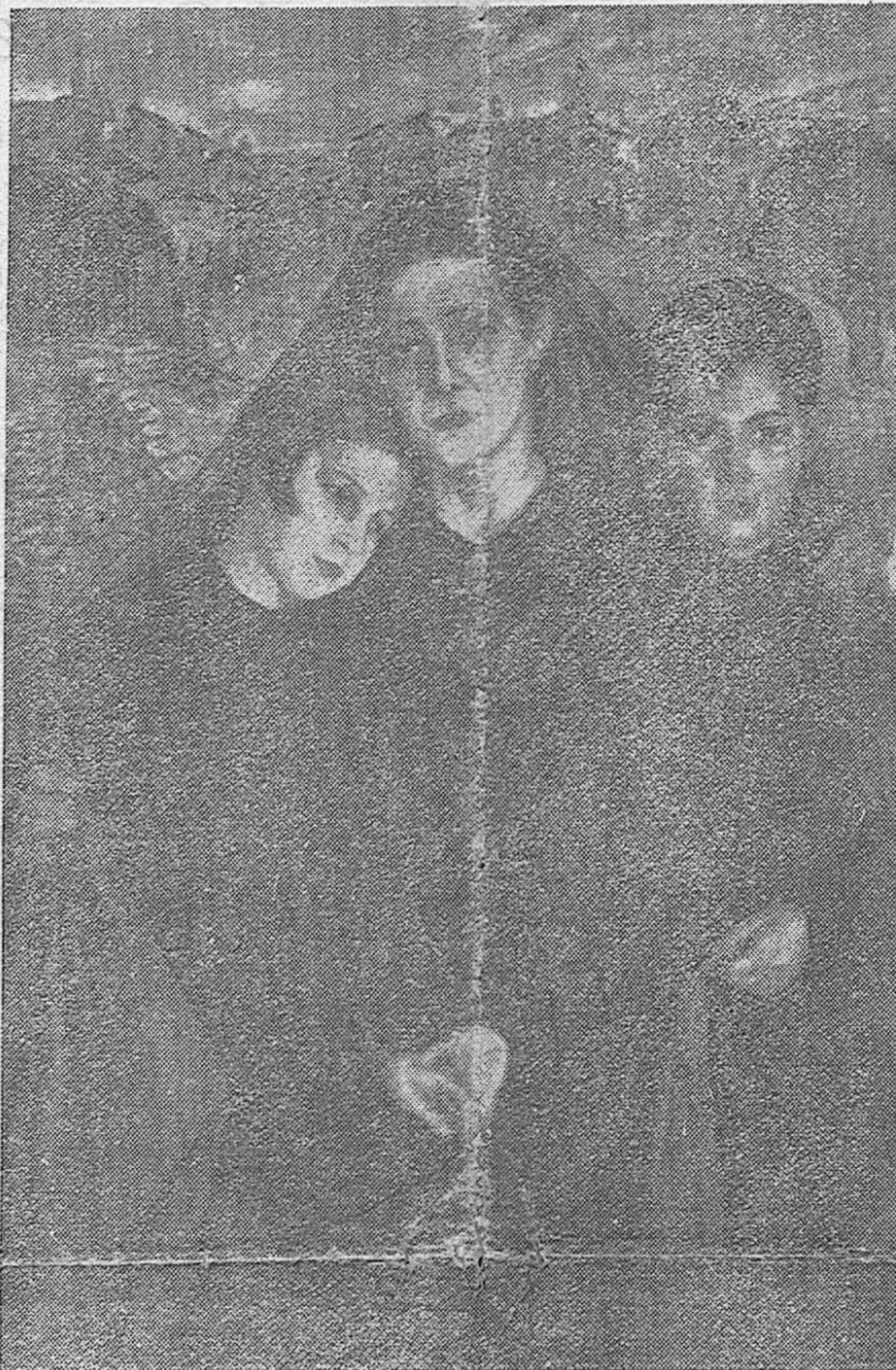
El cuadro de Cuenca Muñoz que ha producido los más elevados y elogiosos comentarios de la crítica de Arte argentina.

Una obra de arte bellísima, llena de intensidad y dramatismo, es este cuadro del pintor cordobés Cuenca Muñoz. Como un guiño del acier artístico, son estas palabras de un juicio sobre el lienzo: "Grabó con admirable arte el dolor de su Patria. En su magistral obra, supo unir a la inspiración artística el hondo sentimiento de su alma".