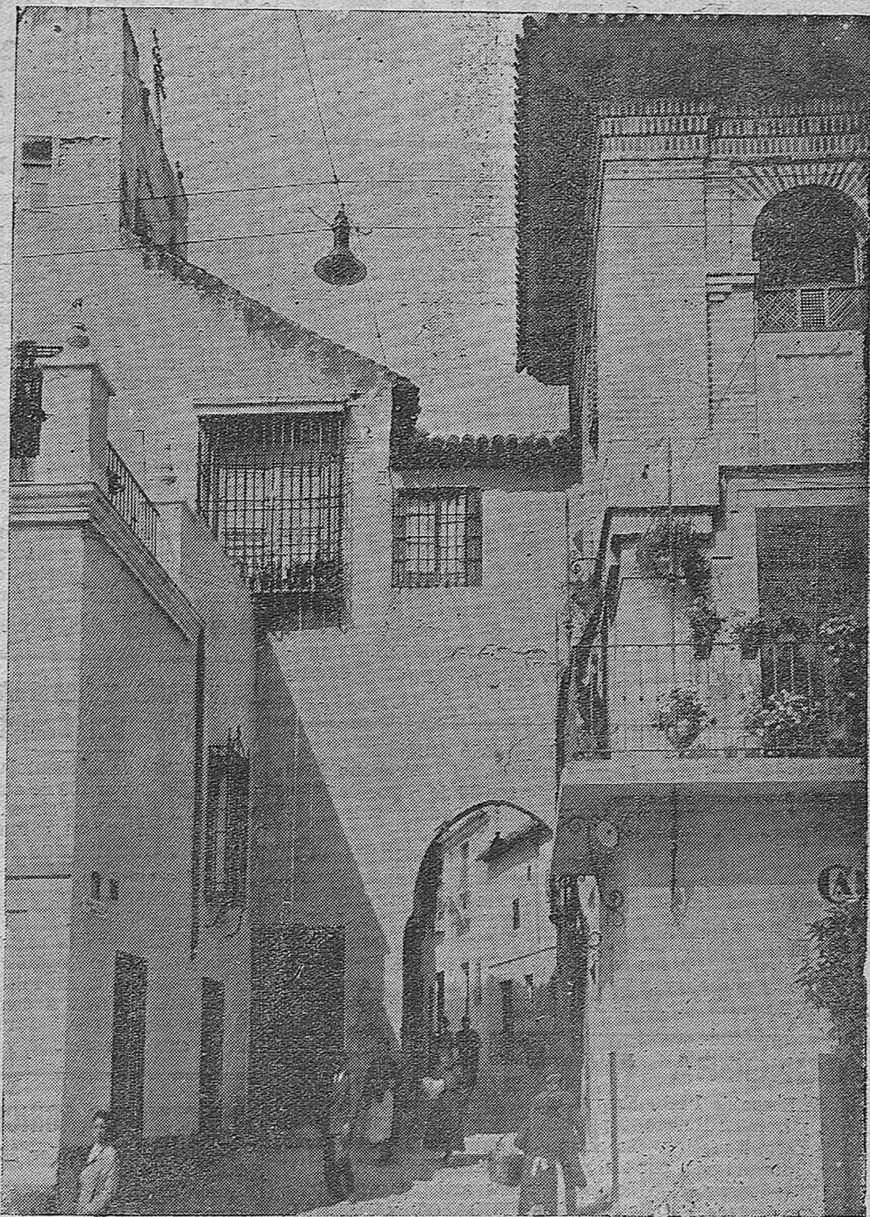
RUTAS DE TURISMO.—Un bello aspecto de la típica calle denominada El Portillo, rincón cordobés admirado por los numerosos turistas que a diario visitan la ciudad