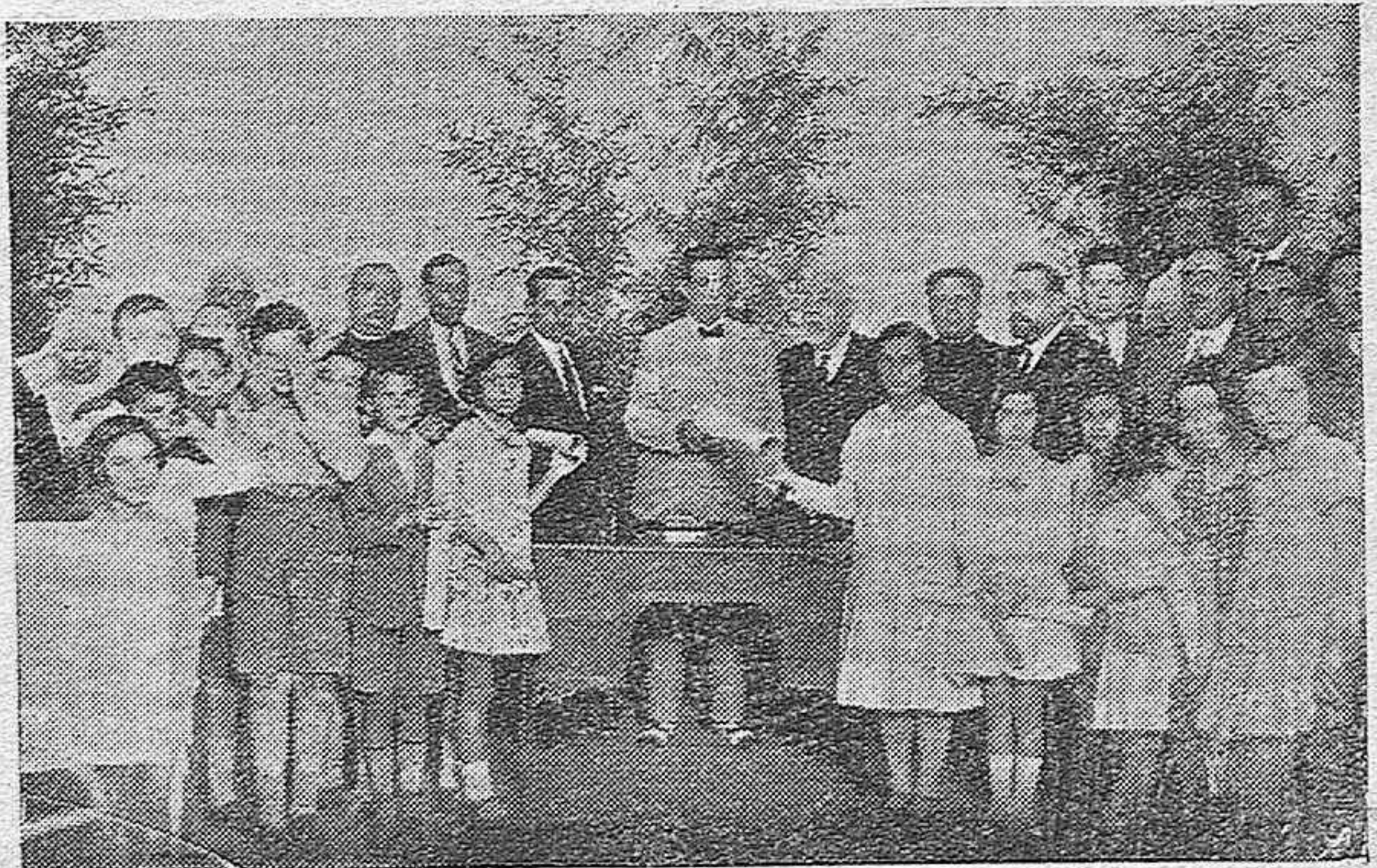
ENTREGA DE PREMIOS Y DIPLOMAS A LOS NIÑOS DE LAS ESCUELAS, CONCEDIDOS CON EL PRODUCTO DE LA TÓMBOLA INSTALADA EN LA VERBENA DE LA VIRGEN DE LOS FAROLES.

Por reciente disposición se incorporan a las Diputaciones los servicios agropecuarios, que tendrán en esta Corporación su organismo oficial. El Gobierno ha querido que esas dos fuentes de riqueza nacional, agricultura y ganadería, reciban el fomento y cuidado de las Diputaciones, con sus nuevos organismos técnicos. El Gobierno