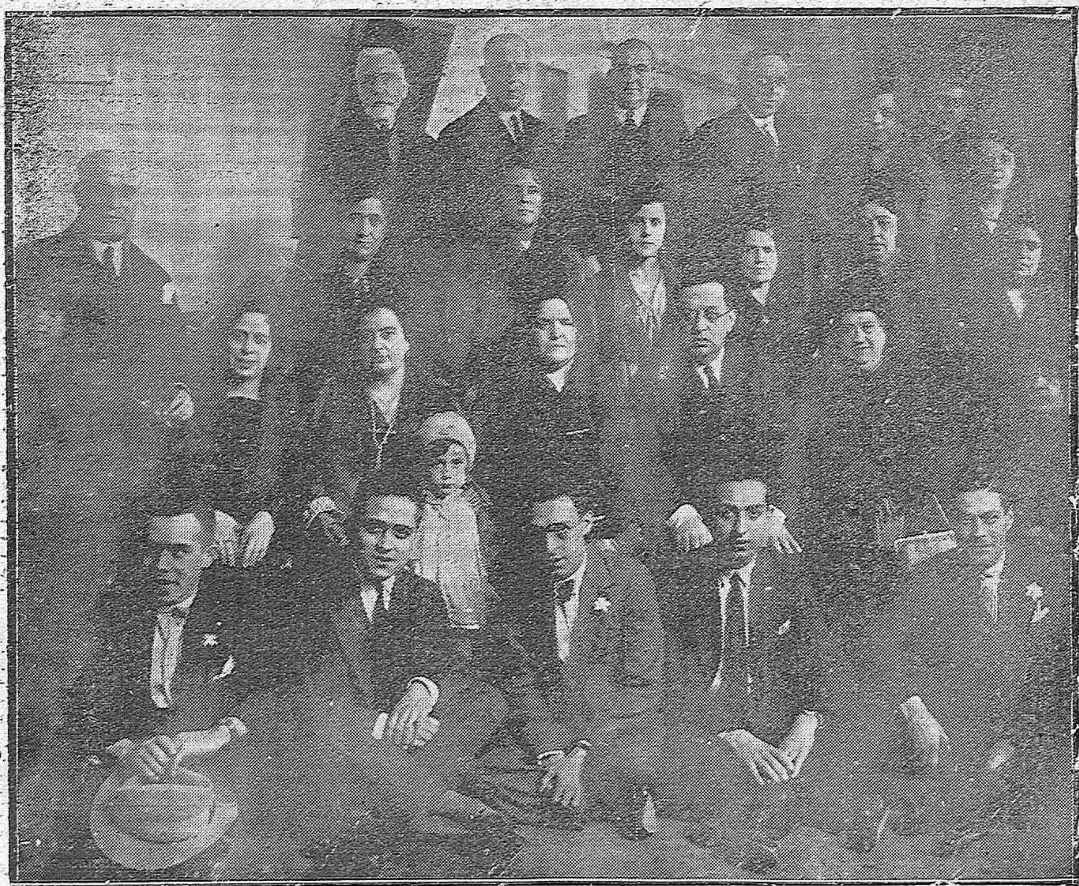
Los Maestros Nacionales al terminar la fiesta religiosa que dedicaron a San Rafael, en la iglesia del Juramento.