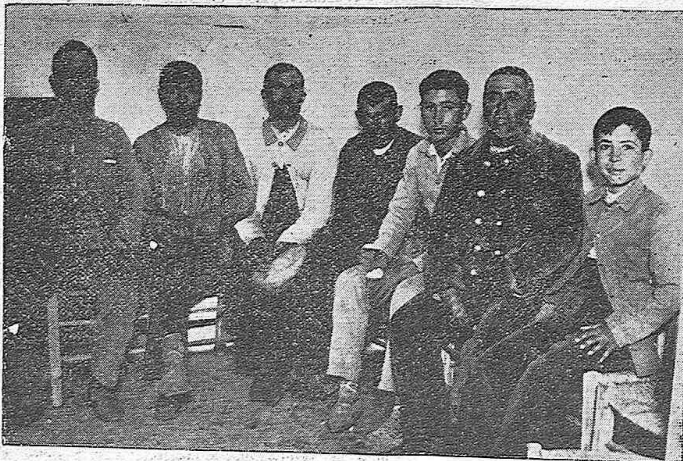
Un grupo de enfermos de las cercanías del Vacar, esperan en la clínica rural la visita del médico.

GANGA: Juegos de cama bordados clase fina y tamaño matrimonio, desde 18 pesetas, en EL METRO y sus tres Sucursales.