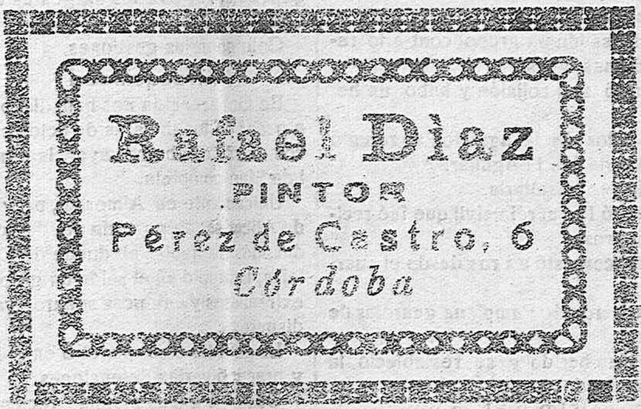
Talla — Restauraciones

PUBLICACIÓN MENSUAL DEDICADA A FOMENTAR LA DEVOCIÓN A LA SANTÍSIMA VIRGEN Administración: Ambrosio de Morales, 6 Córdoba Suscripción: De propáganda, 4 pesetas al año Corriente, 5 pesetas Suscriptores protectores: A voluntad