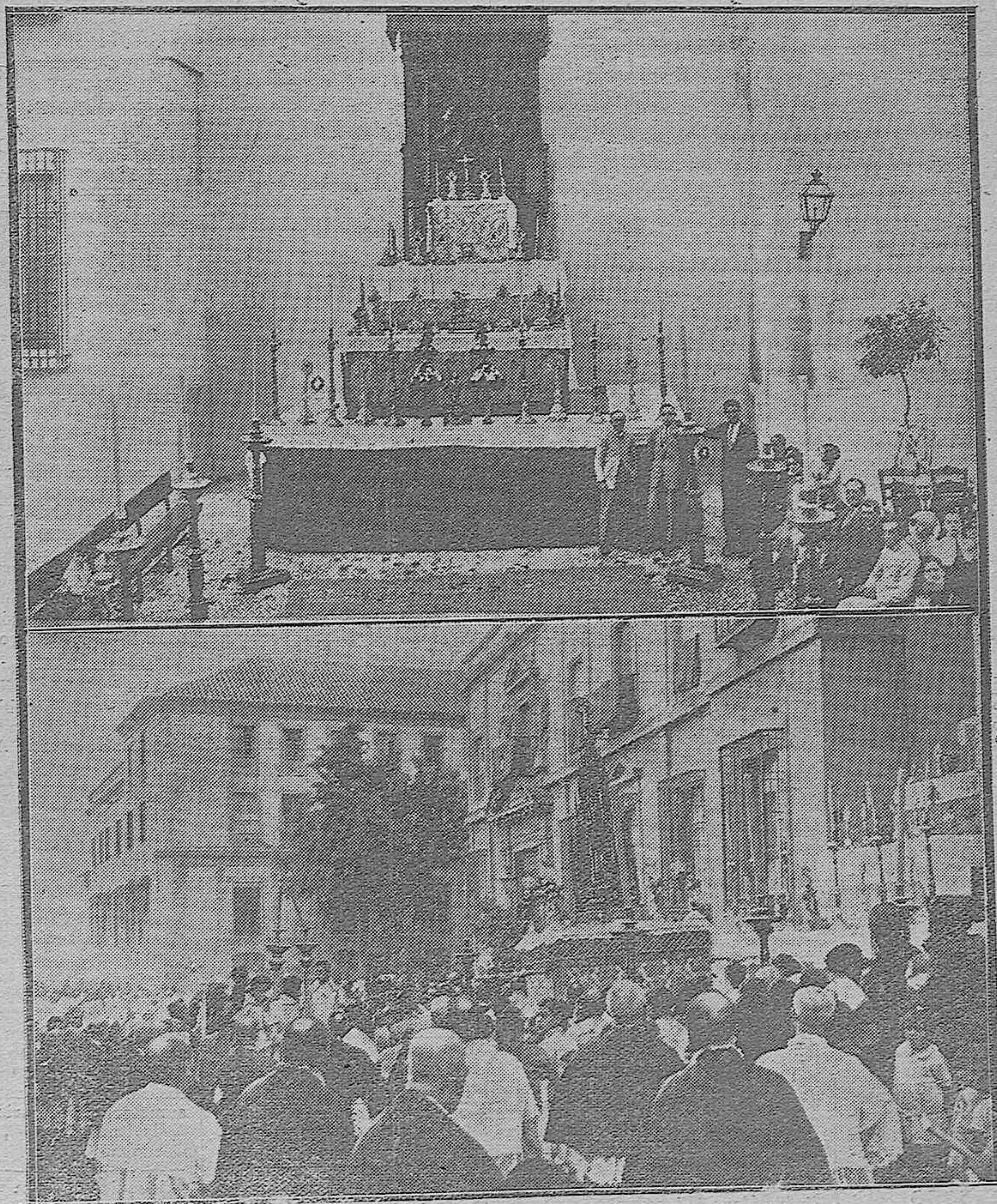
LA PROCESIÓN DE LA OCTAVA DEL CORPUS.—Magnífico altar levantado en la fachada del Palacio Episcopal.—La Custodia haciendo estación ante el altar.