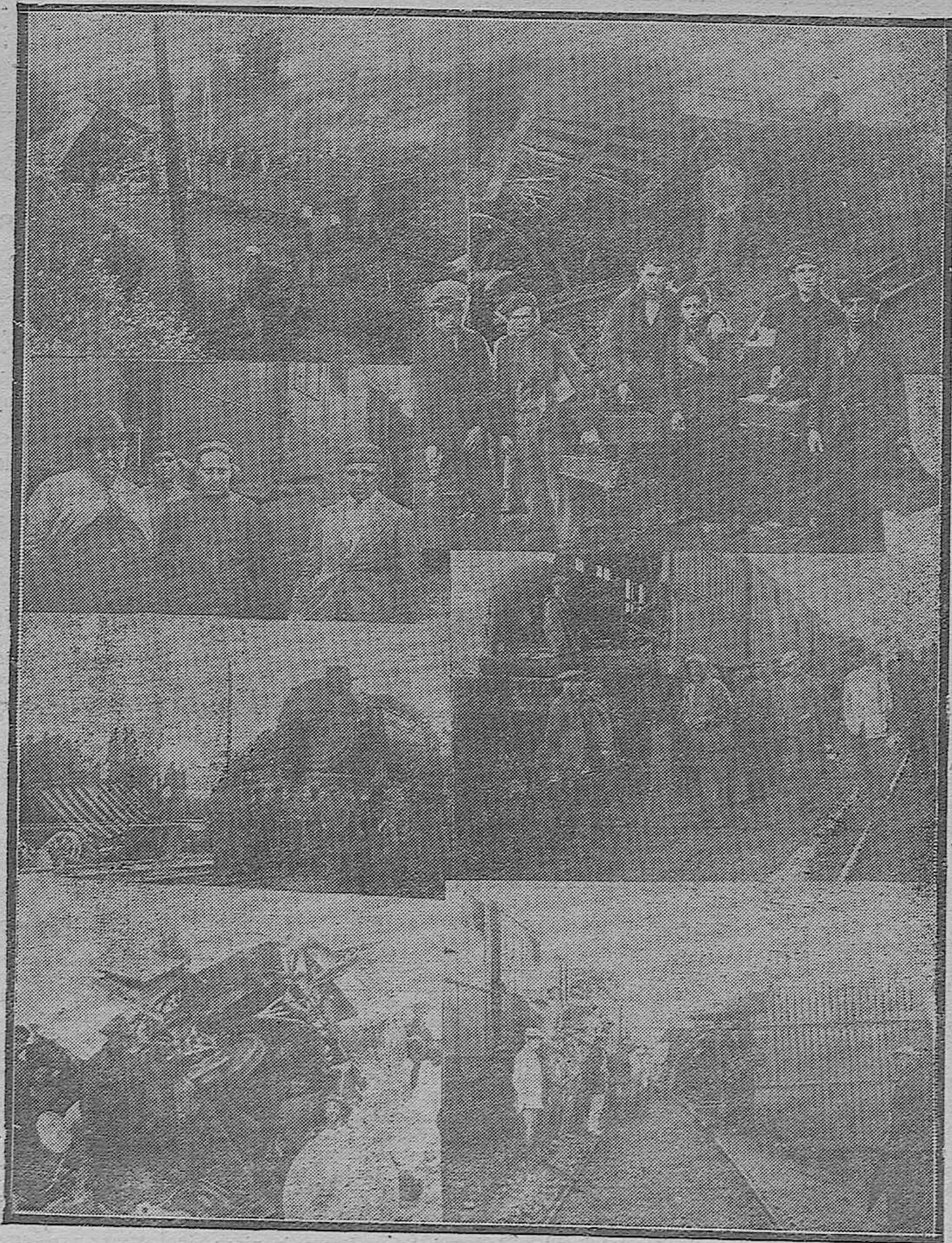
LA CATÁSTROFE DE PALMA DEL RIO.—ASPECTO QUE OFRECÍA EL LUGAR DEL SUCESO.—VAGON DEL MERCANCÍA DESTROZADOS POR EL CHOQUE.—LOS AMBULANTES DE CORREOS QUE RESULTARON MILAGROSAMENTE CON VIDA.—GRUPO DE BETUNEROS QUE VIAJABAN EN EL EXPRESO.—CÓMO QUEDÓ LA MÁQUINA DEL EXPRESO.—ESTADO EN QUE QUEDÓ EL COCHE CORREG.—DETALLE DE UN VAGON DESPUES DEL CHOQUE.—LLEGADA DE UN TREN DE SOCORRO