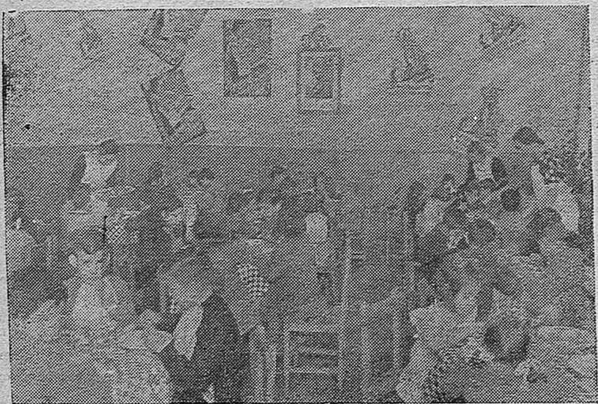
Vista parcial de uno de los Comedores de «Auxilio Social» que el equipo de Córdoba instaló en el Distrito del Hospital al día siguiente de la liberación de Madrid.

Mercedes Sanz Bachiller, la esposa de Ontésimo, tiene entre sus manos complica-