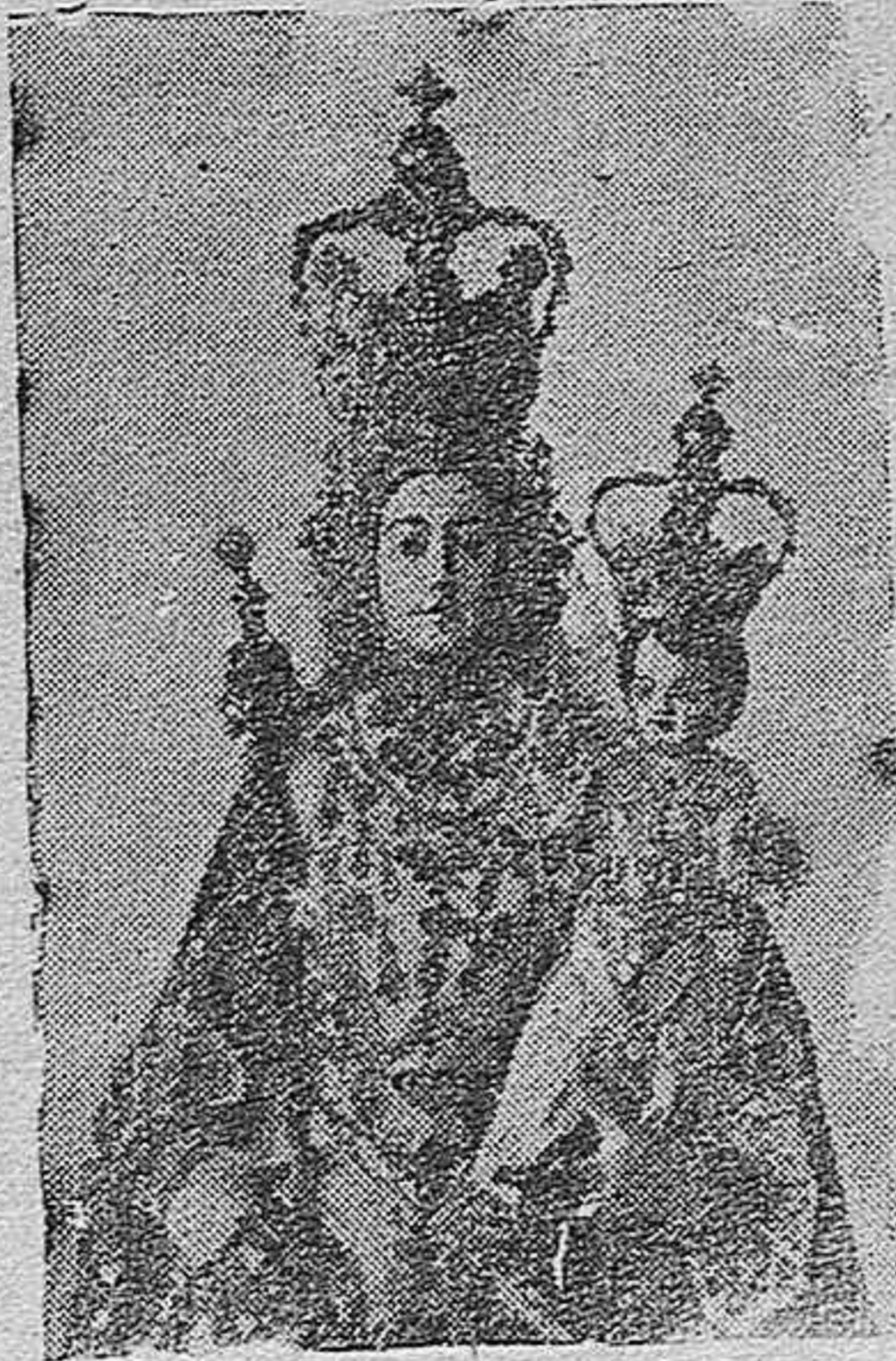
Nuestra Señora de Araceli Patrona de Lucena

Para ello, el entusiasmo y decidido empeño de la primera Autoridad municipal, ca-