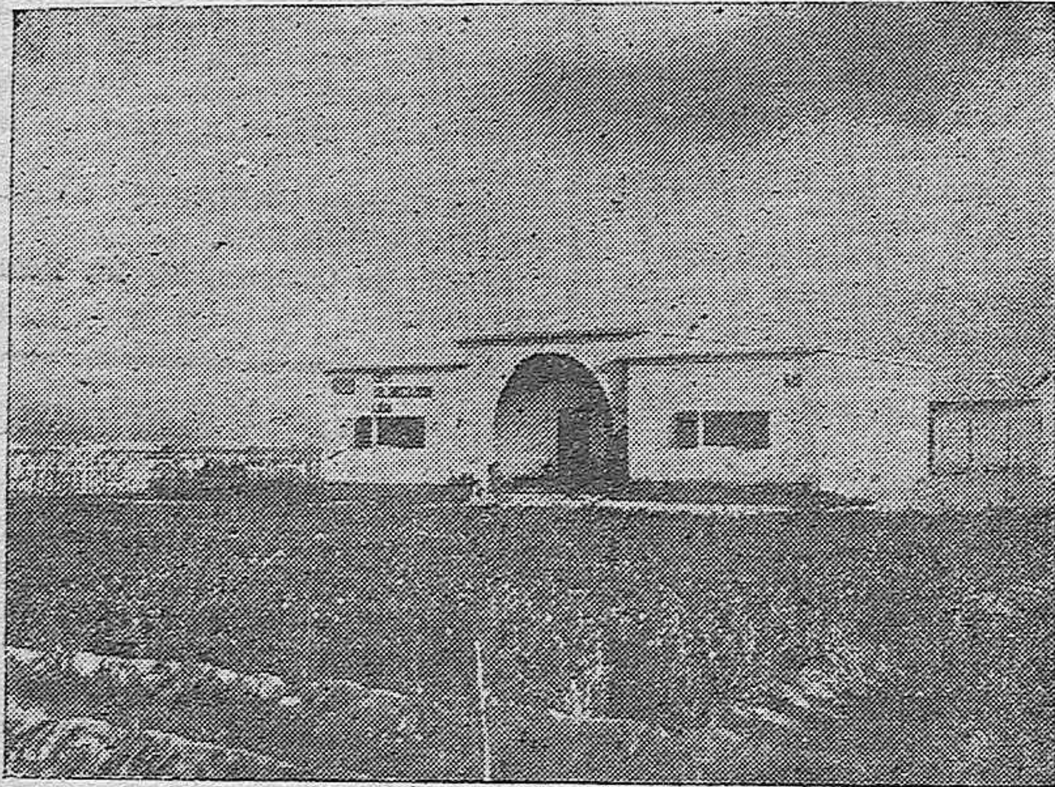
TIPO DE CASA COLONIAL EN LIBIA

En total, el número de casas que serán construídas por el referido Ente pro colonización de Libia y por el Instituto Nacional Fascista de Previsión Social, en Tripolitania, es de 883. A ellas hay que agregar las que se deben a la iniciativa de agricultores particulares y de sociedades concesionarias.