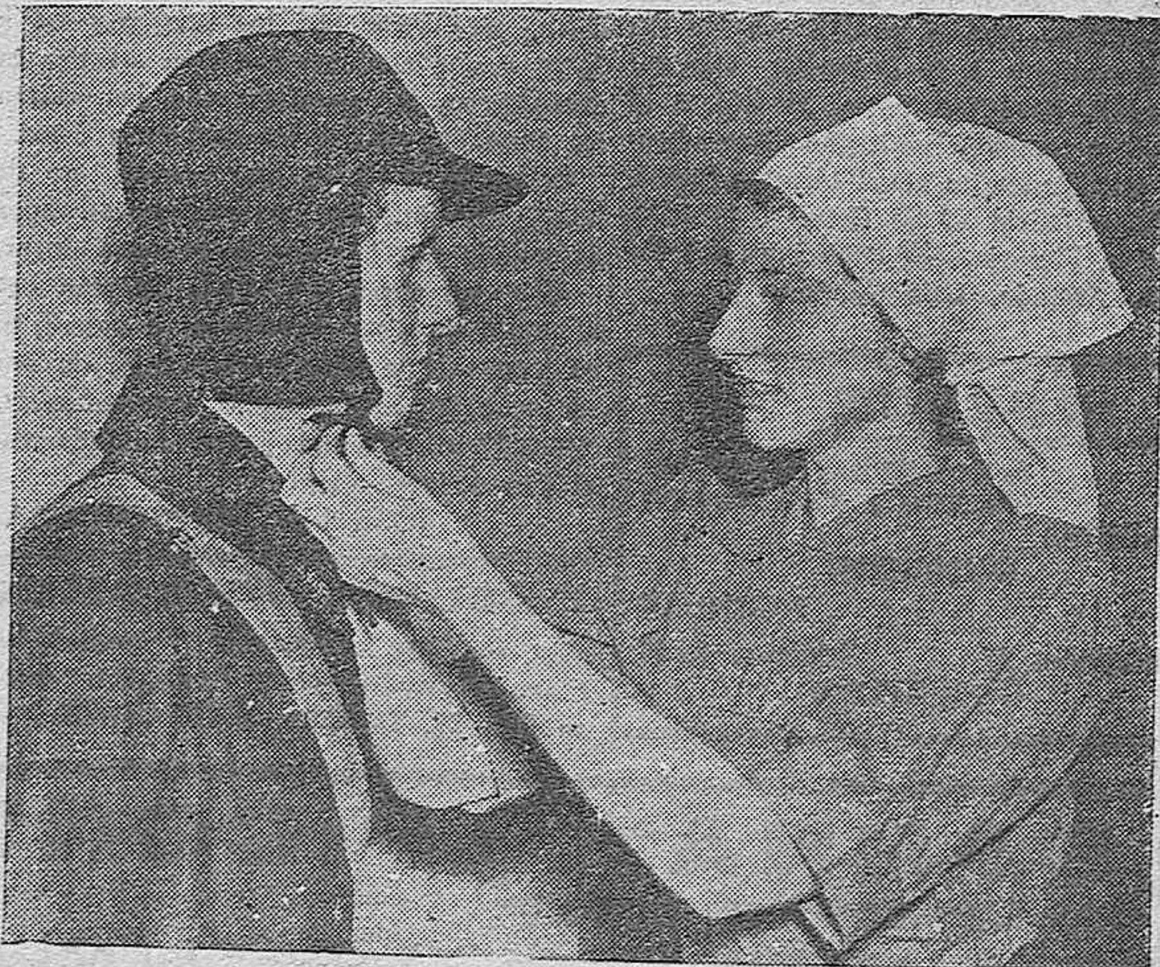
Las muchachas inglesas alistadas en el servicio «Air Rai Precaución» han sido dotadas de un nuevo uniforme como el que aparece vistiendo esta muchacha de la izquierda.

El acto, que resultó hondamente emotivo, revistió la sencillez y sobriedad propias de la Falange.