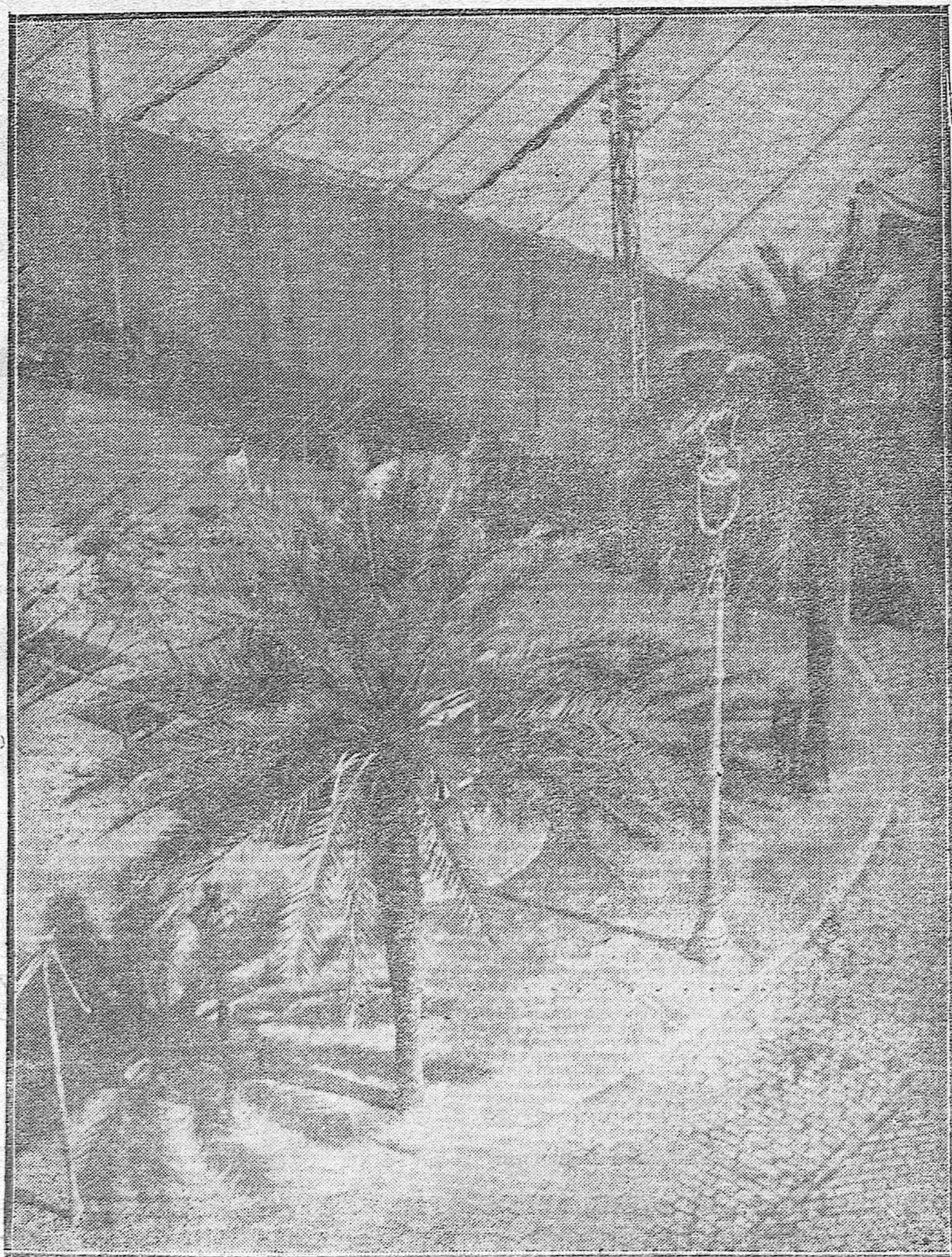
CÓRDOBA.—PARTE DEL PASEO DEL GRAN CAPITÁN, POR DONDE VA A EFECTUARSE EL ENSANCHE PARA DESCONGESTIONAR LA PLAZA DE SAN NICOLÁS.