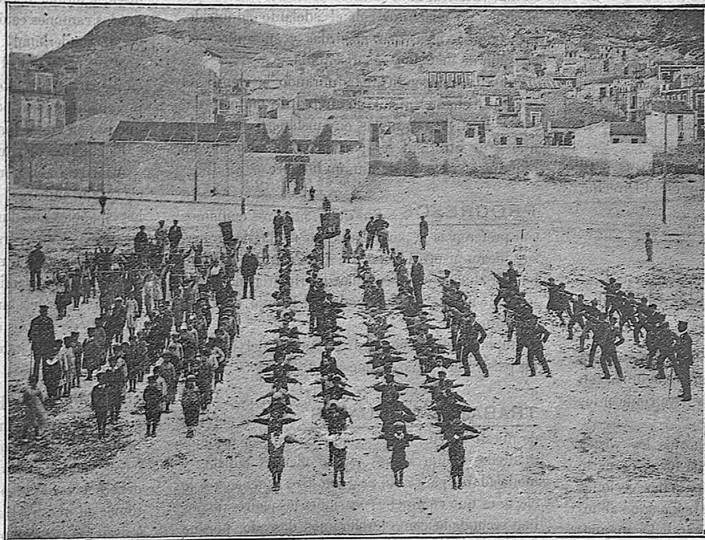
LOS ALUMNOS HACIENDO EJERCICIOS GIMNÁSTICOS

EDIFICIO propio.--Salones contruídos según las prescripciones de la Higiene y de la Pedagogía.-- Grandes patios para recreo de los alumnos.-- Agua corriente y abundante.--Filtros.--Aparatos para la gimnasia.--Ventiladores en cada salón.-- Cinematógrafo.--Linterna mágica.--Microscopio.-- Mecanografía.--Deportes.--Juegos.--Ejercicio de tiro.--Excursiones escolares.--Música. ▼ ▼ ▼ ▼ ▼