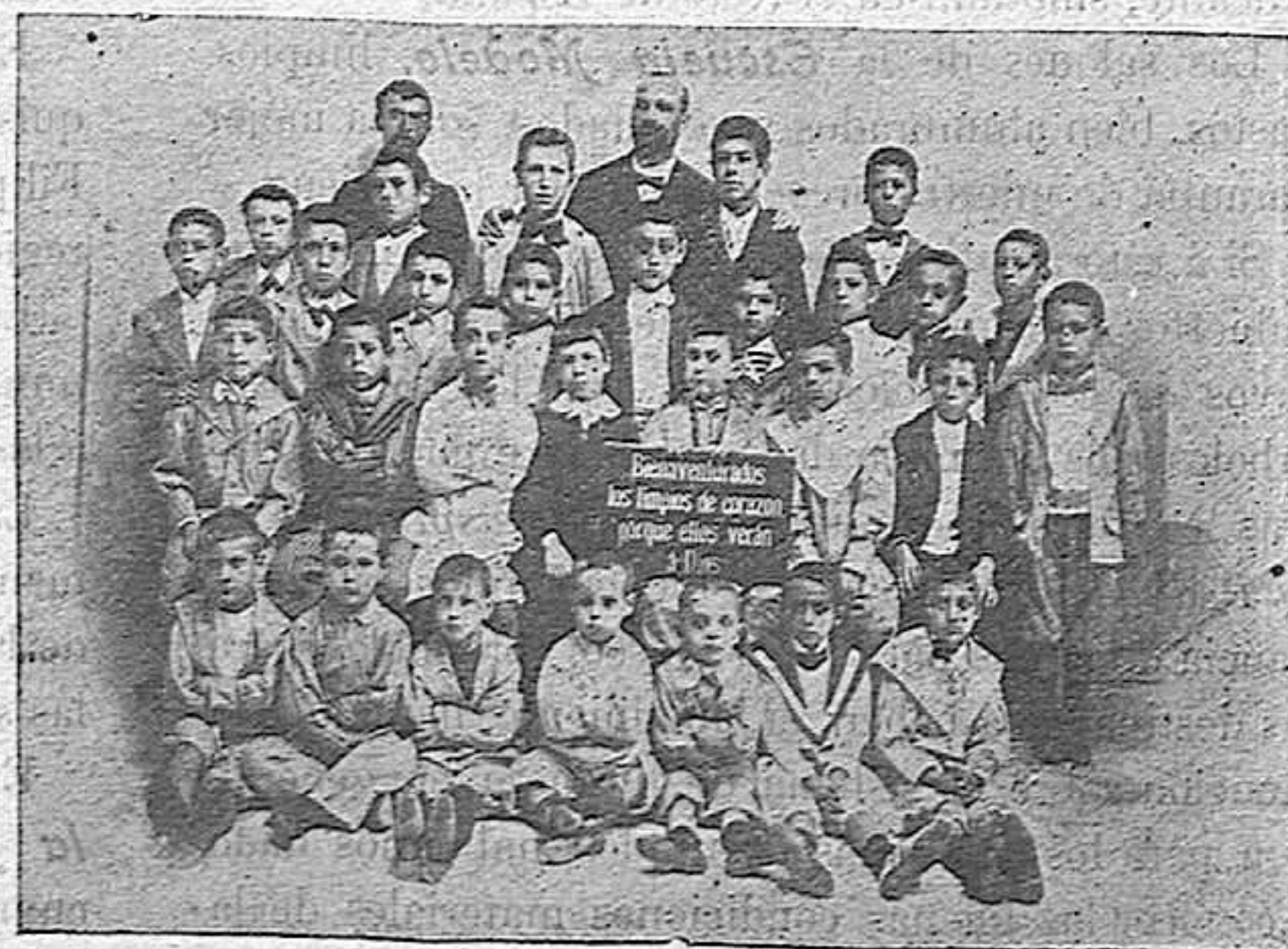
LA "ESCUELA MODELO" EN 1897