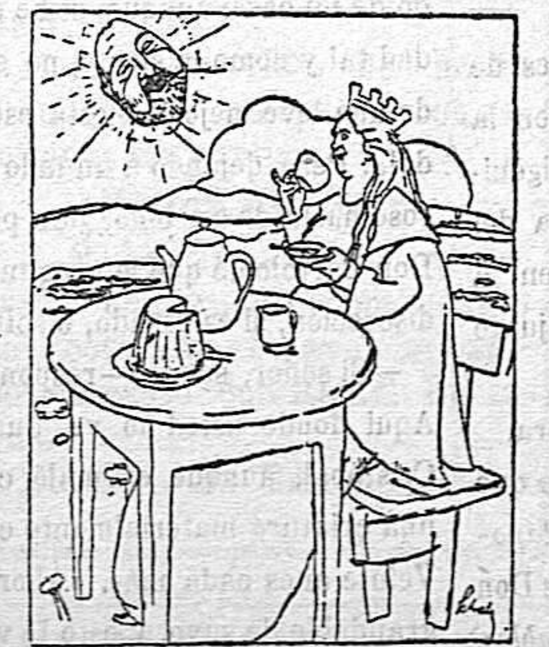
El sol de primavera beneficia con sus rayos á la convaleciente España.