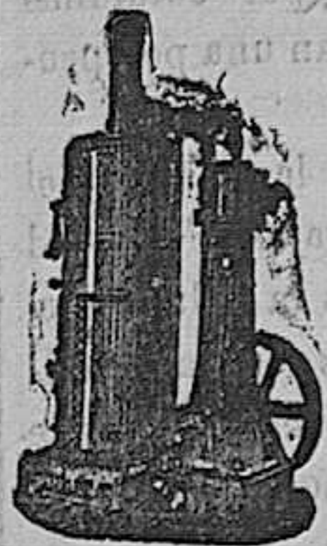
maquina de vapor vertical

Maquinas de vapor, Bombas, Prensas, Tubos de todas clases