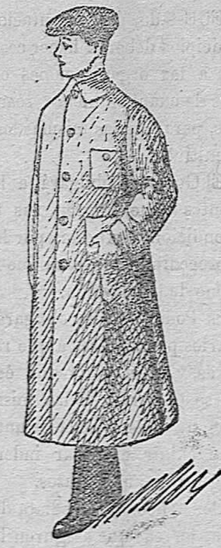
GUARDAPOLVO CABALLERO de 8 pesetas a 20; para Jóvenes y niños desde 4'50 a 15 ptas.