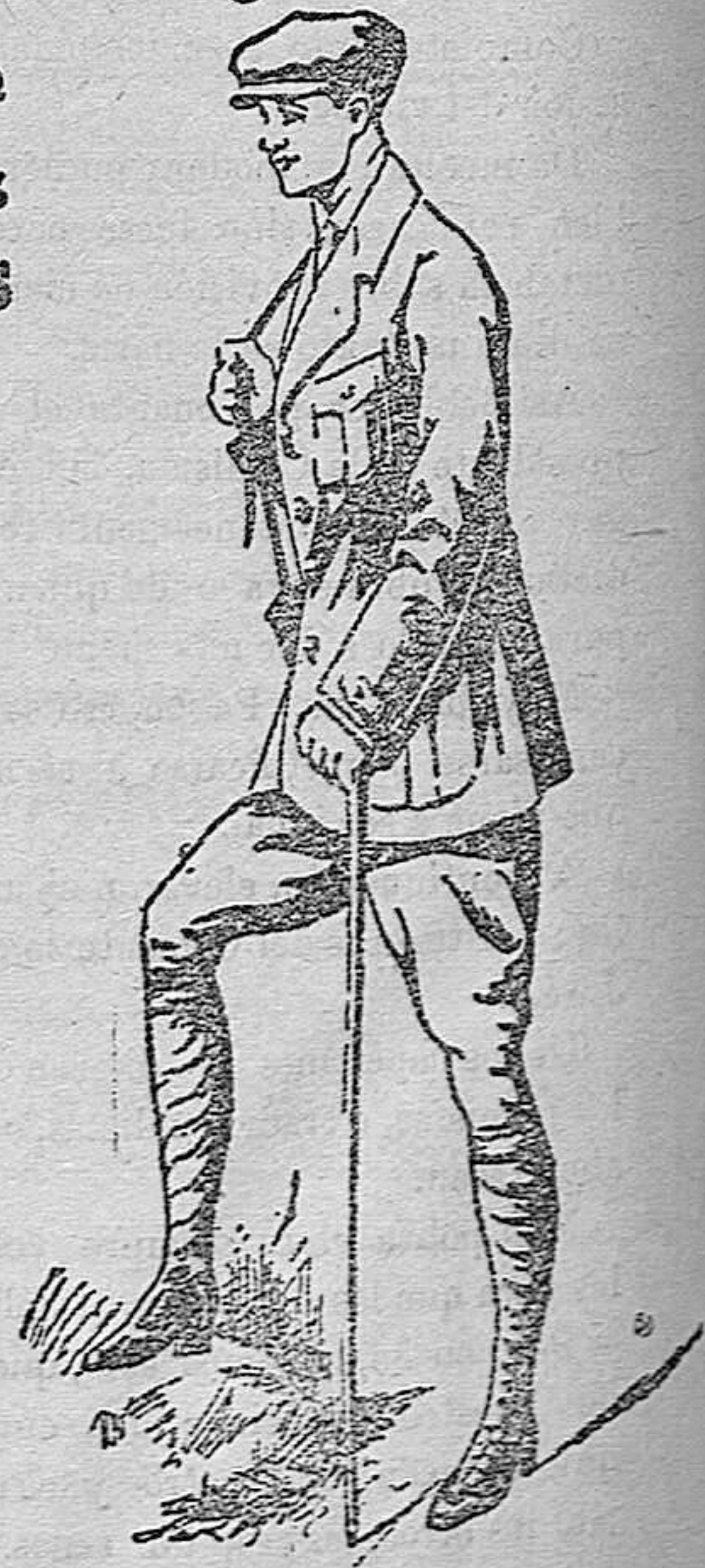
TRAJES SPORT en Pana y paño desde 45 pesetas a 70.