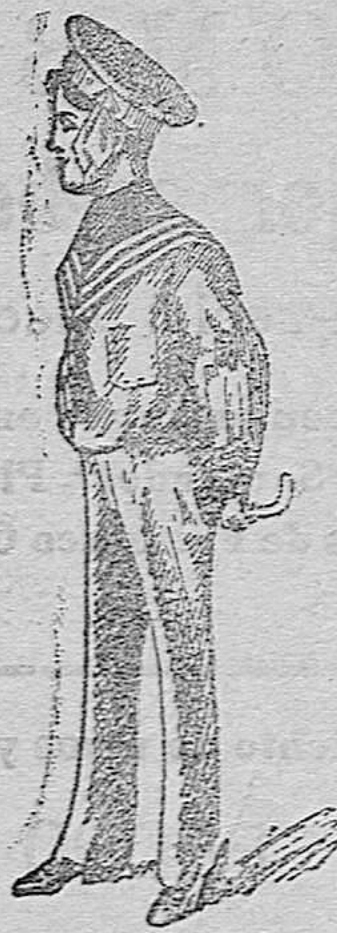
50 MODELOS DIFERENTES en trajecitos de niño, en Paño, Gergas y Panas a 9 pesetas, 12, 15, 20 y 25 ptas.