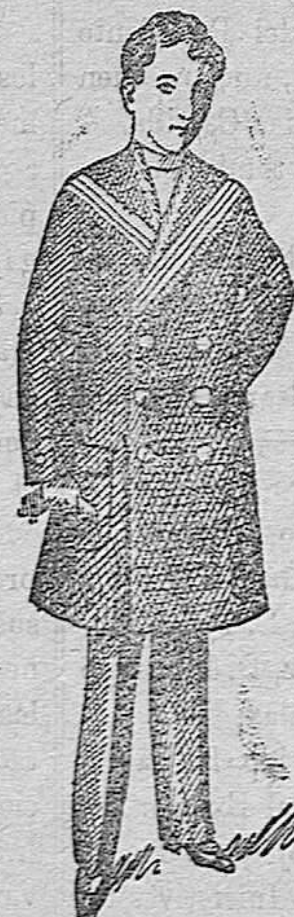
ABRIGOS Y MATELOS para Jóvenes y niños desde 15 pesetas a 60.