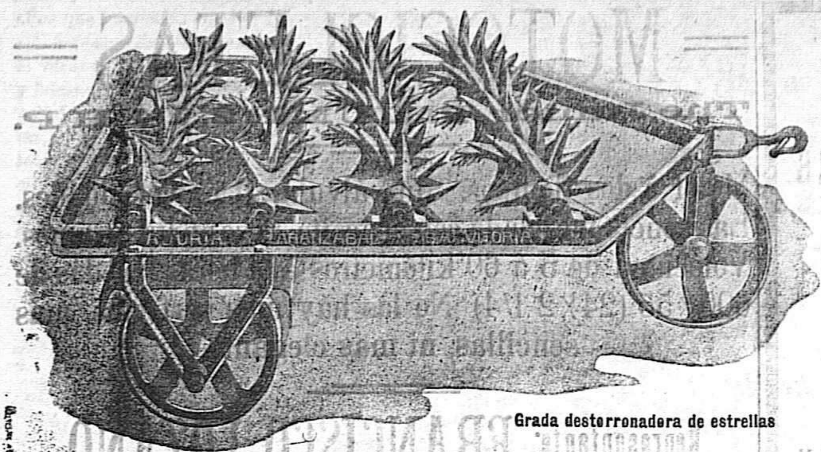
Grada desterronadora de estrellas