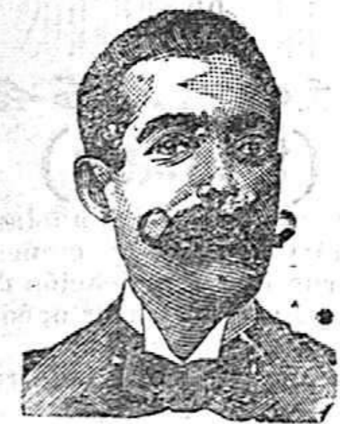
A. Sati Costanzi Diputación, 435, Barcelona

PROCURADOR ELECTO.—II Apodaca II 2.º 2.ª—TARRAGONA