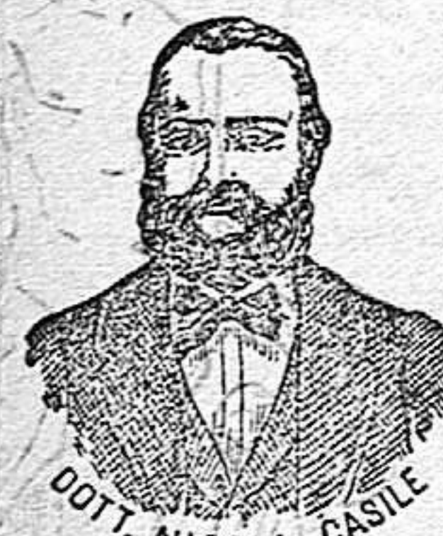
Invencor de los renombrados medicamentos CASILE. Diputación, 435 BARCELONA