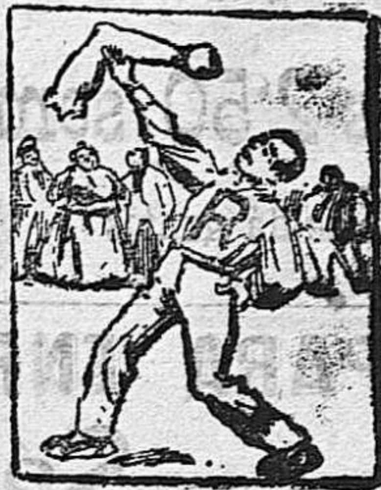
(La solución en el número próximo).