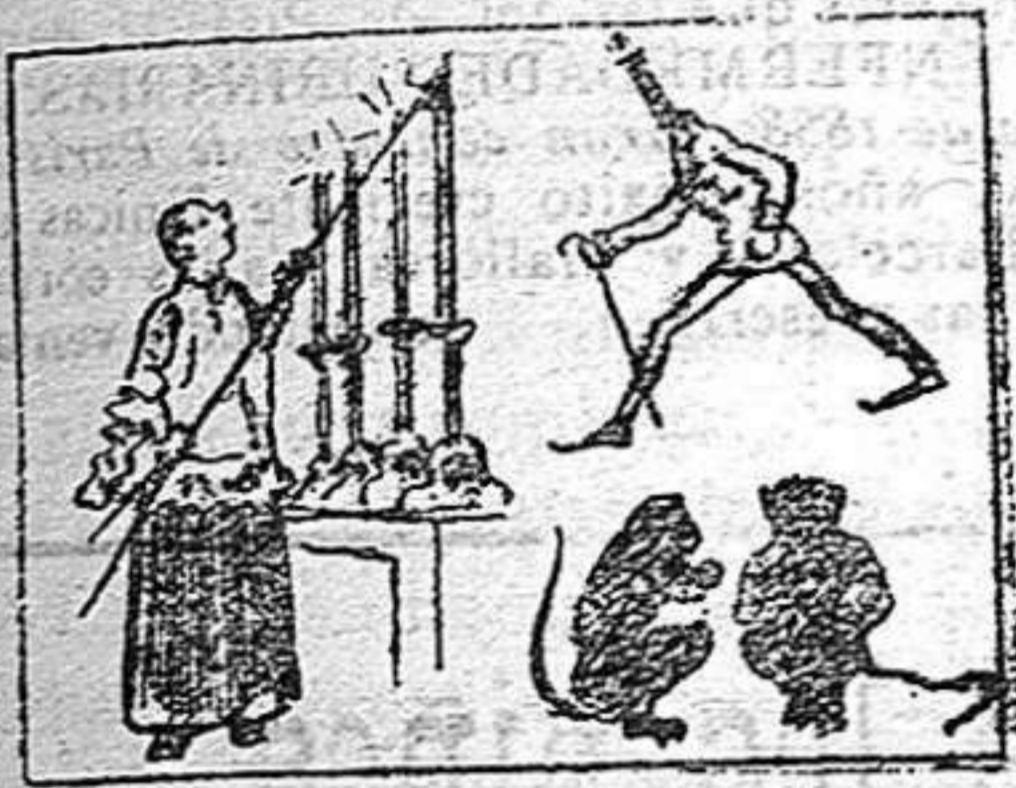
(La solución en el número próximo).