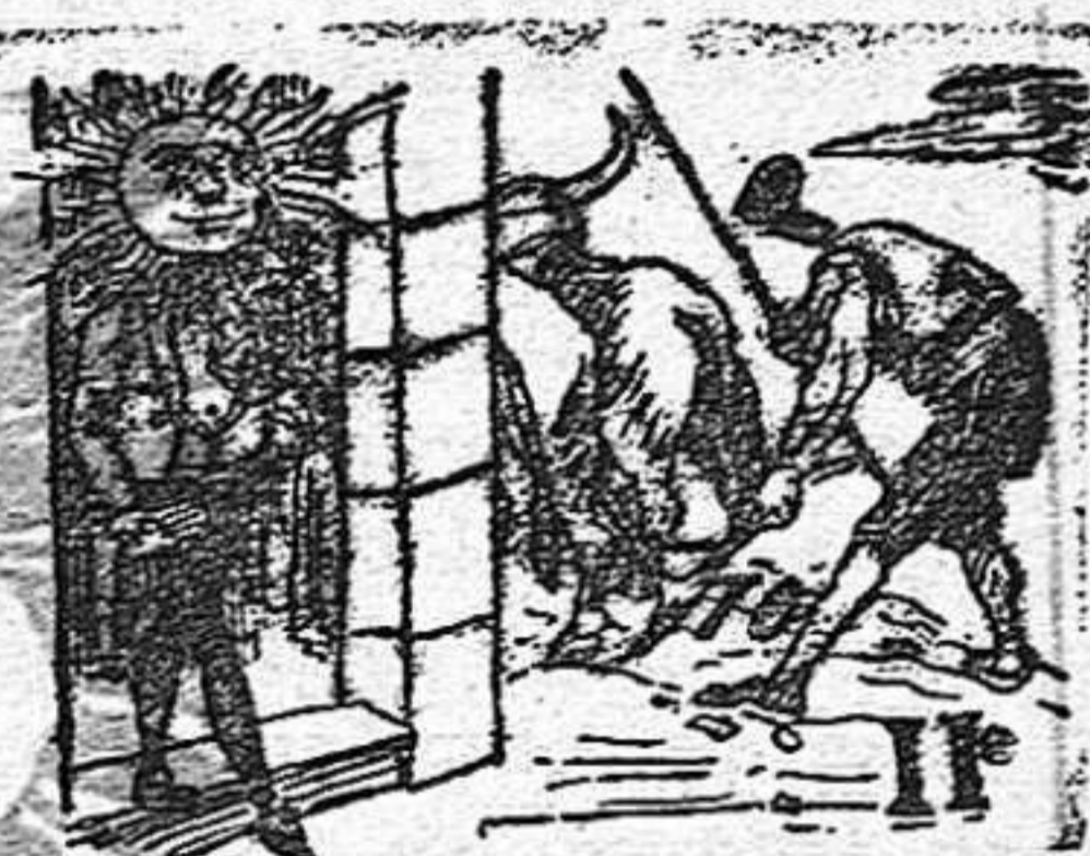
(La solución en el número próximo).