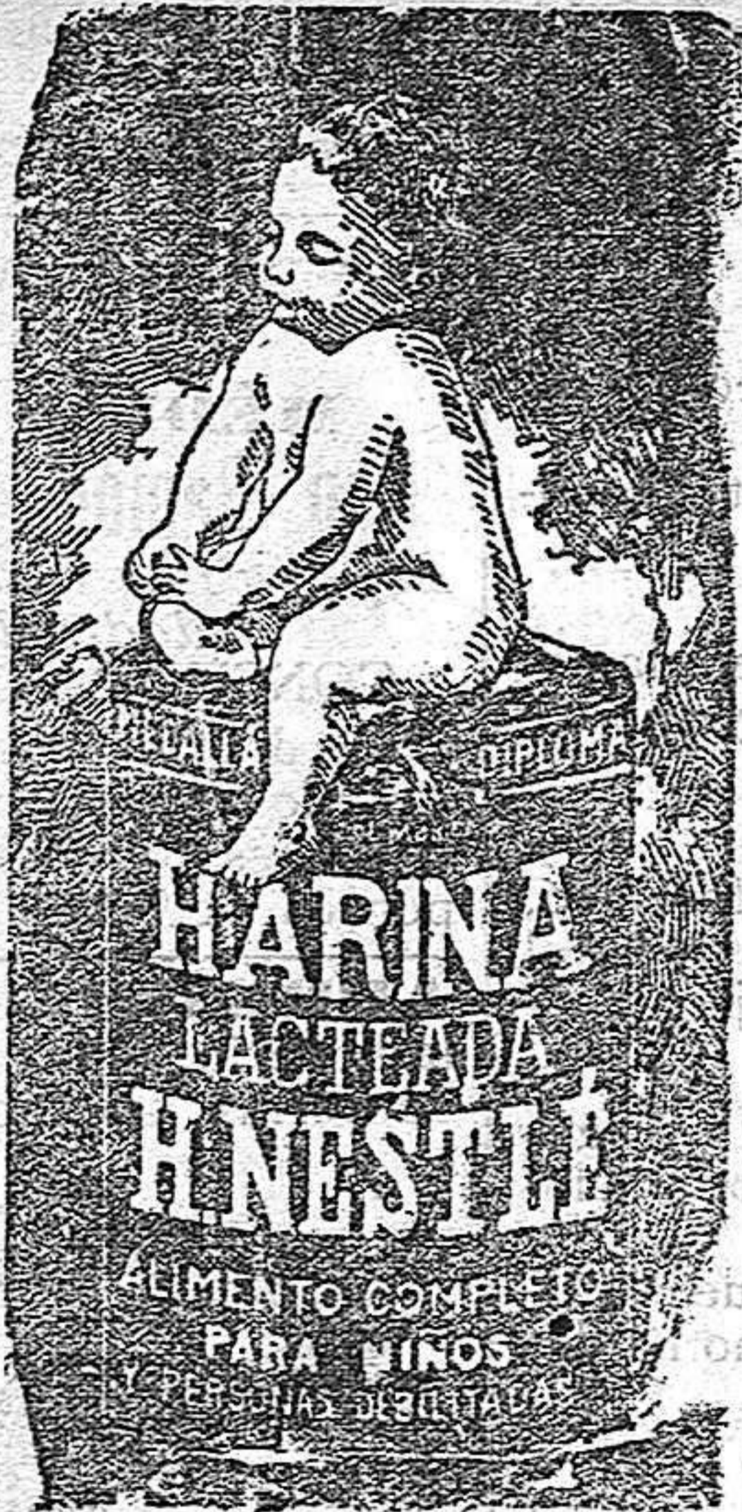
DEPOSITO GENERAL VINDA DE RAFAEL ROMERO JERE